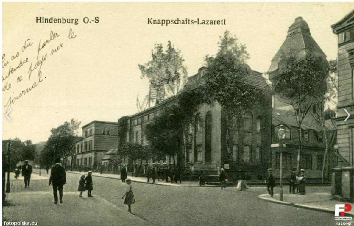
Widok dawnej ulicy Dorothenstrasse lata: 1905-1920r.