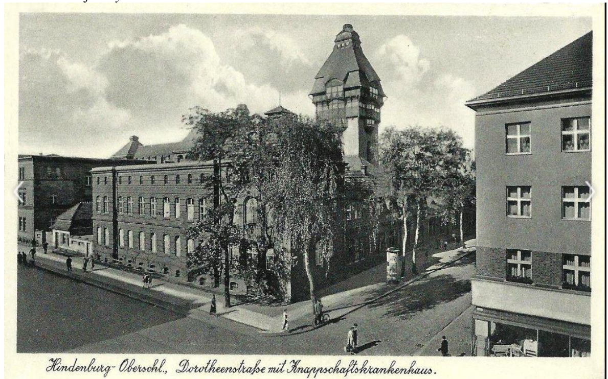
Widok dawnej ulicy Dorothenstrasse lata: 1935-1945r.