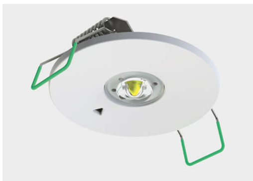
Rysunek 2.2.2. Oprawa oświetlenia awaryjnego II