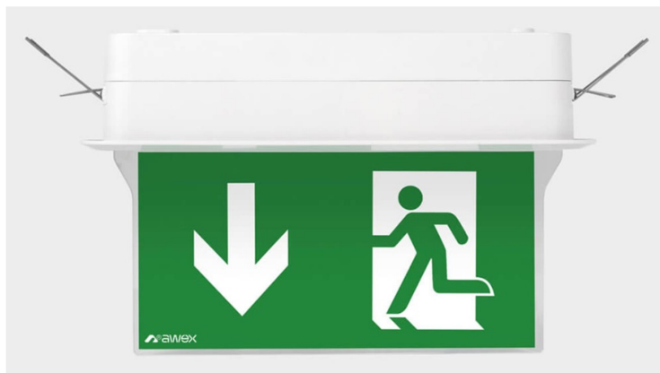
Rysunek 2.2.4. Oprawa oświetlenia awaryjnego IV