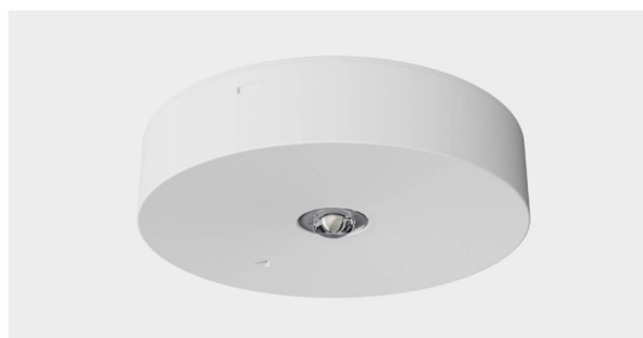
Rysunek 2.2.1. Oprawa oświetlenia awaryjnego I