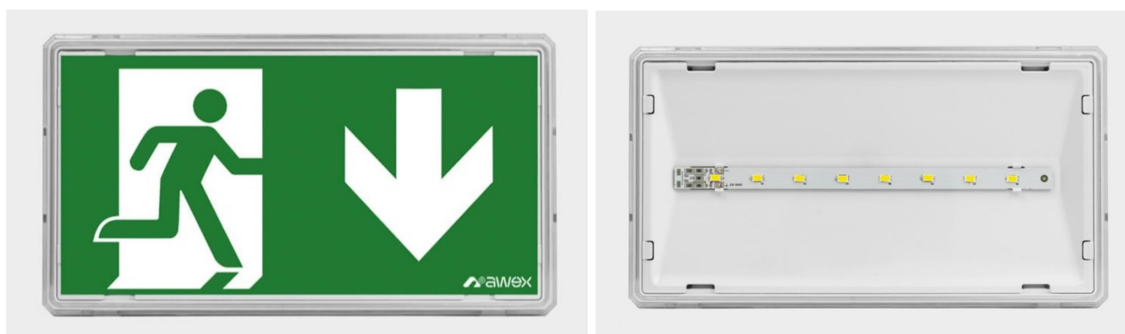
Rysunek 2.2.5. Oprawa oświetlenia awaryjnego V