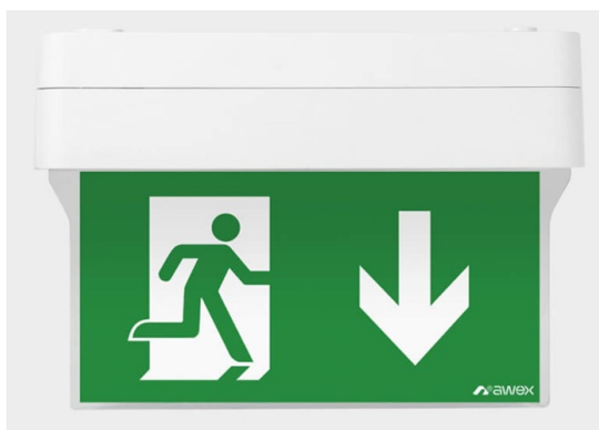
Rysunek 2.2.3. Oprawa oświetlenia awaryjnego III