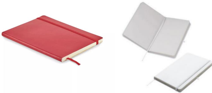
Obraz 1 Przykładowy notatnik