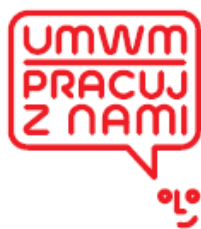
Obraz 11 Znak UMWM Pracuj z nami