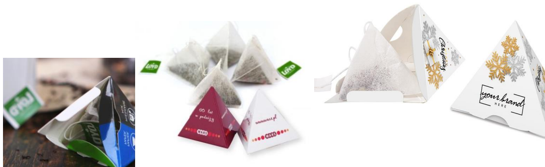
Obraz 8 Przykładowe herbaty w piramidkach