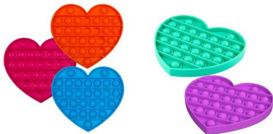
Obraz 9 Przykładowe POPIT serce