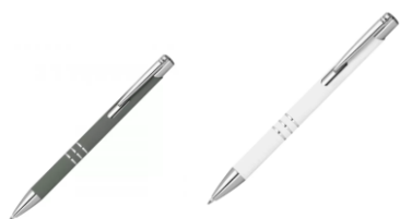
Obraz 3 Przykładowy długopis