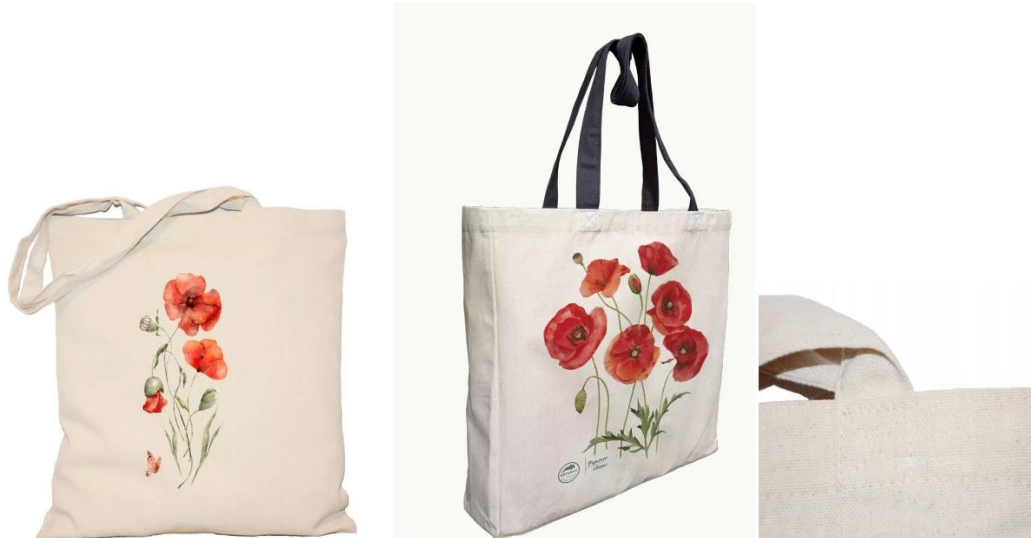
Obraz 4 Przykładowa torba