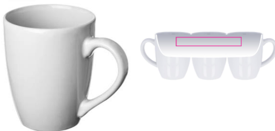
4. INSIDE TC