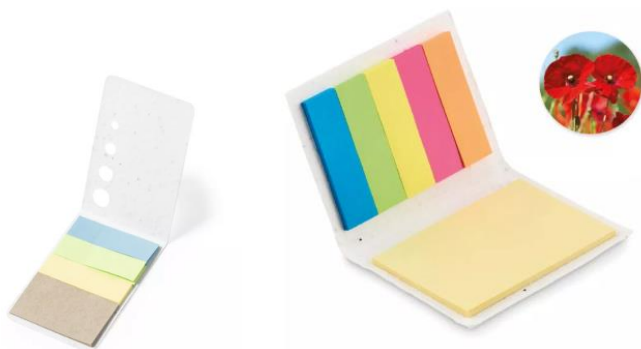
Obraz 5 Przykładowe notatniki