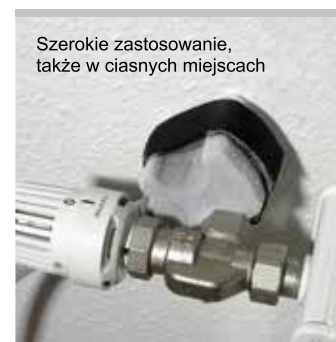
Szerokie zastosowanie, także w ciasnych miejscach