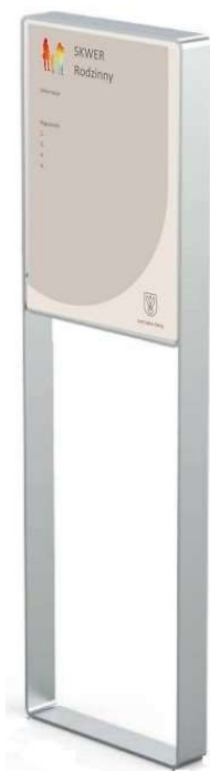
Fot. 2 Zdjęcie poglądowe tablicy regulaminu