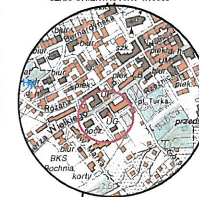
SKZIC ORIENTACYJNY 1:10000