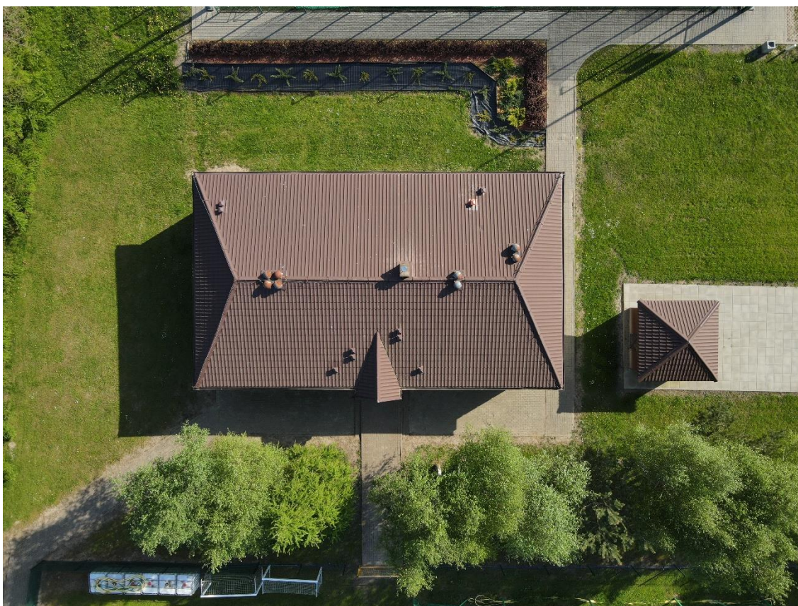
Rysunek 1. Zdjęcia budynku z drona.

Na podstawie powyższych danych opracowano koncepcję lokalizacji systemu fotowoltaicznego.