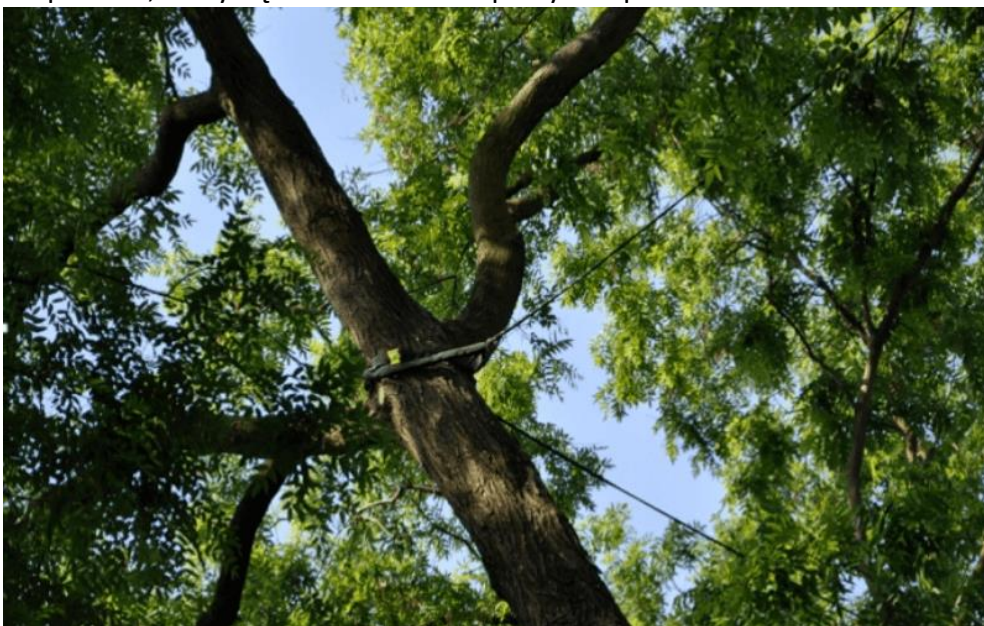
Zdj. nr 1. Wiązania elastyczne typu COBRA w koronie [źródło: www.wroclaw.pl , „Pielęgnacja pomników przyrody”, stan z 08.2023 r.]

Pielęgnację pomników przyrody oraz terenów wpisanych do rejestru zabytków należy powierzyć profesjonalnym firmom arborystycznym, stosującym metody propagowane przez Europejską komisję ds. drzew (European Arboricultural Council-EAC) oraz Ogólnoświatowe Międzynarodowe Towarzystwo ds. drzew (International Society of Arboriculture – ISA). Czynnikiem decydującym o wykonaniu zlecenia nie powinna być tylko cena a doświadczenie [źródło: www.wroclaw.pl , „Pielęgnacja pomników przyrody”, stan z 08.2023 r.]. Należy powołać inspektora, który będzie nadzorował powyższe prace.