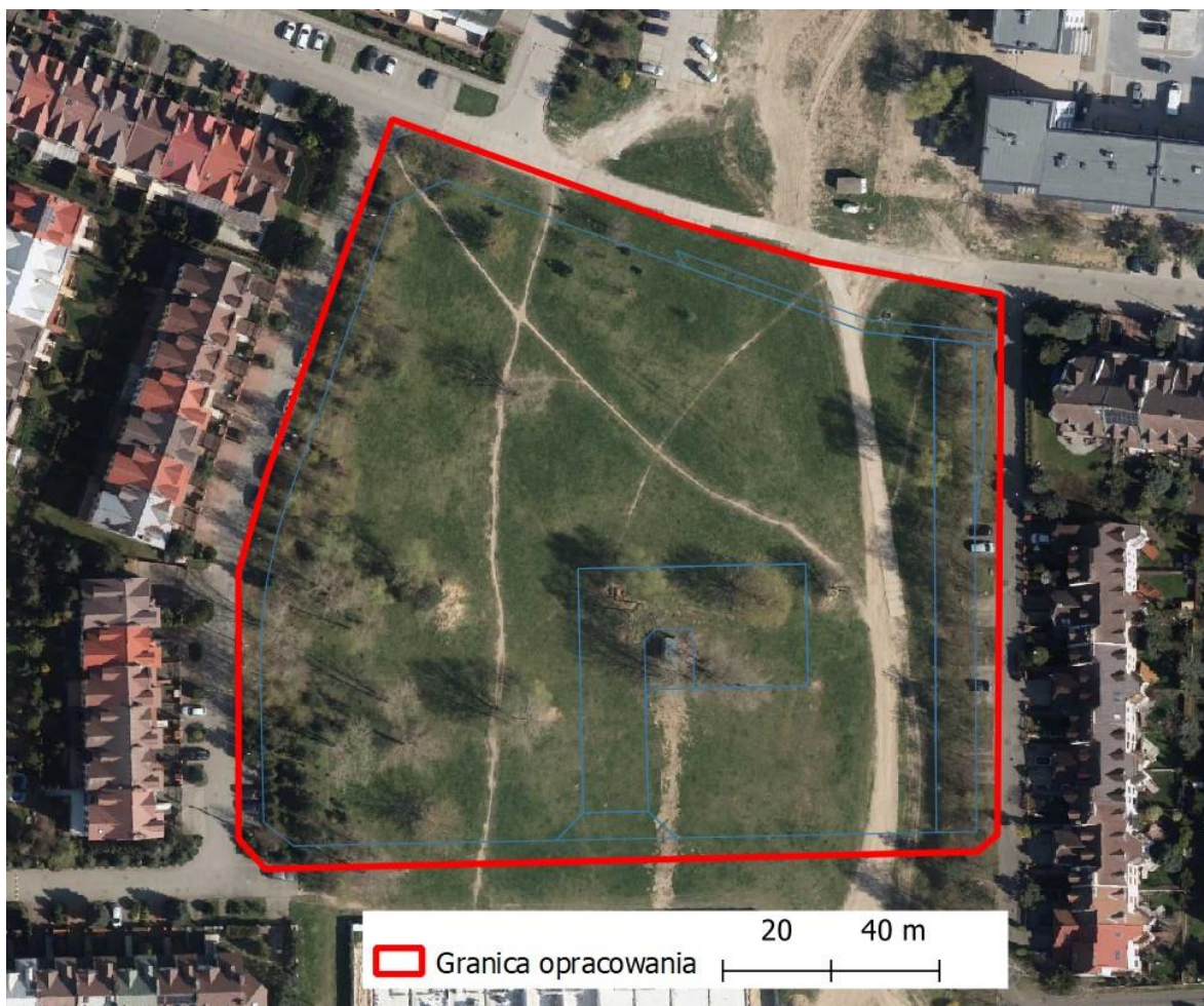
Ryc. nr 1. Lokalizacja terenu opracowania – mapa pogłówna

Przegląd drzew wykonano metodą VTA a wyniki przedstawiono w zestawieniu tabelarycznym [Tab. nr 1.]. W skład inwentaryzacji dendrologicznej wchodzi również waloryzacja dendrologiczna, przyrodnicza oraz operat dendrologiczny.