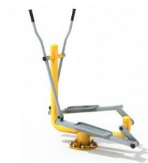
Rysunek przykładowy Wymiary podane w wartościach minimalnych