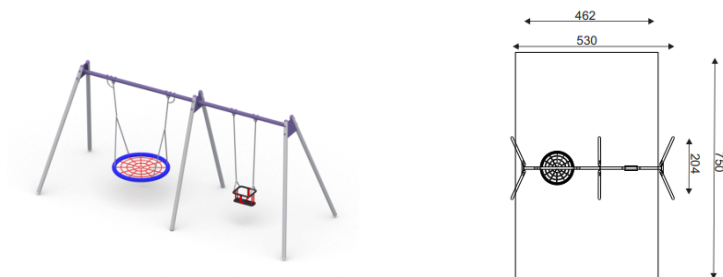
Rysunek przykładowy Wymiary podane w wartościach minimalnych

nogi stalowe 6 szt. ż belka stalowa 2 szt. ż siedzisko płaskie z łańcuchem nierdzewnym 1 szt. ż siedzisko bocianie gniazdo 1