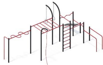
Rysunek przykładowy Wymiary podane w wartościach minimalnych