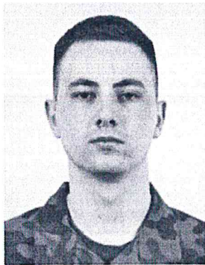
RYСУNEK 2 (FRYZURA - PRZYKŁAD)