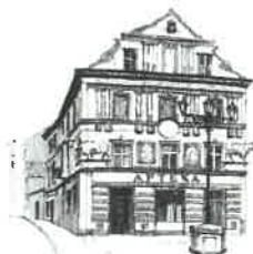
Kamienica „Pod Bykami”