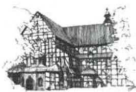
Kościół Pokoju pw. Św. Trójcy Wpisany na listę UNESCO