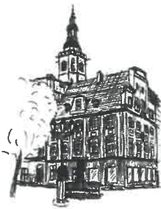
Rynek Wieża ratuszowa