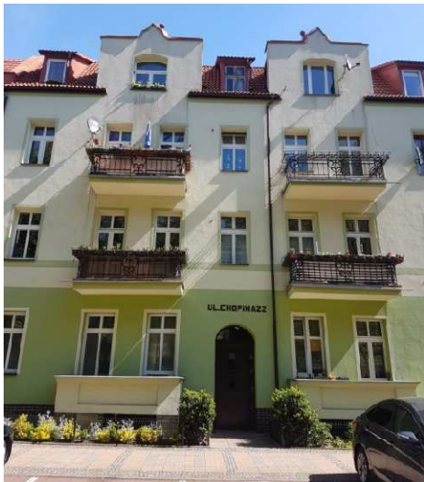
Fot. nr 1 elewacja frontowa