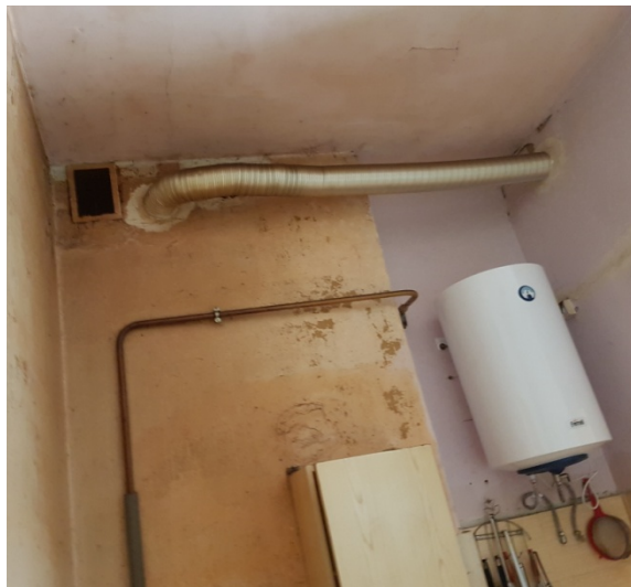
Fot. nr 2 istniejąca kuchnia