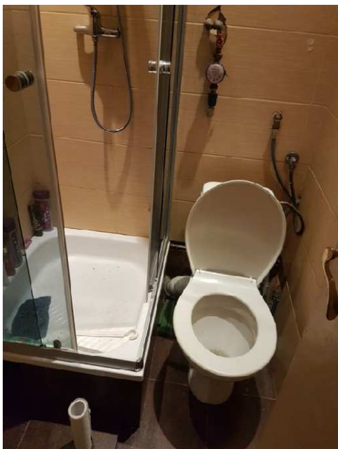
Fot. nr 3 istniejąca łazienka