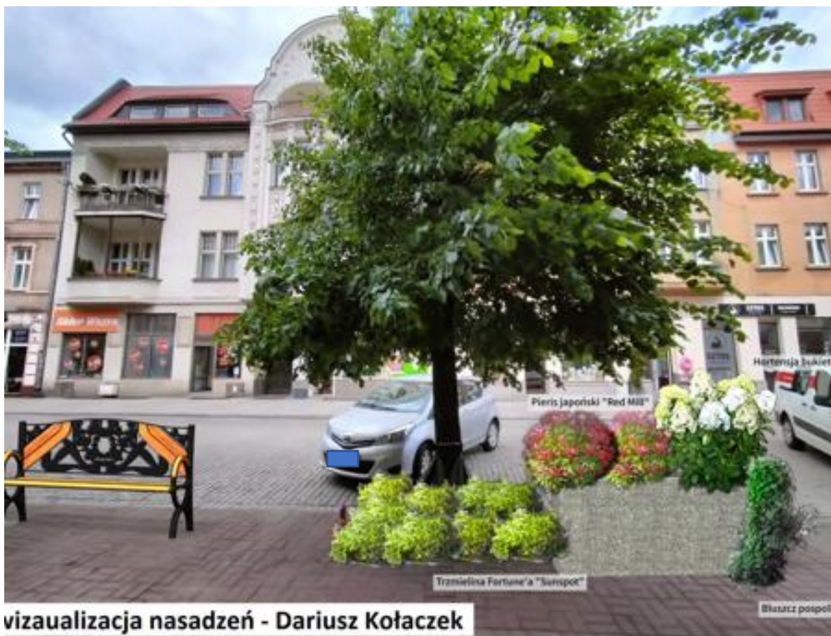
wizualizacja nasadzeń - Dariusz Kołaczek