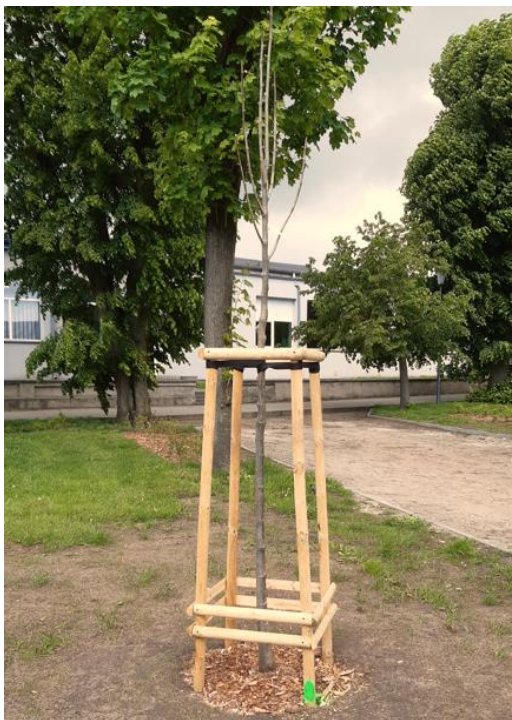
Przykładowe zdjęcie ramki do drzew