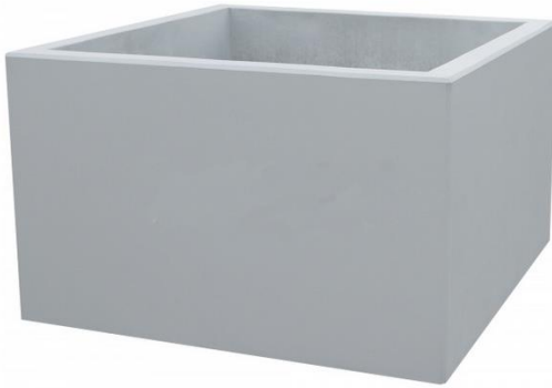
Rysunek 1. Przykład donicy betonowej o wym. [cm] 120x100x60 kolor jasny szary

Donice muszą być ustawione równomiernie, w zgodzie z przepisami o ruchu drogowym, w tym z zachowaniem minimalnej odległości 50 cm od skrajni jezdni.