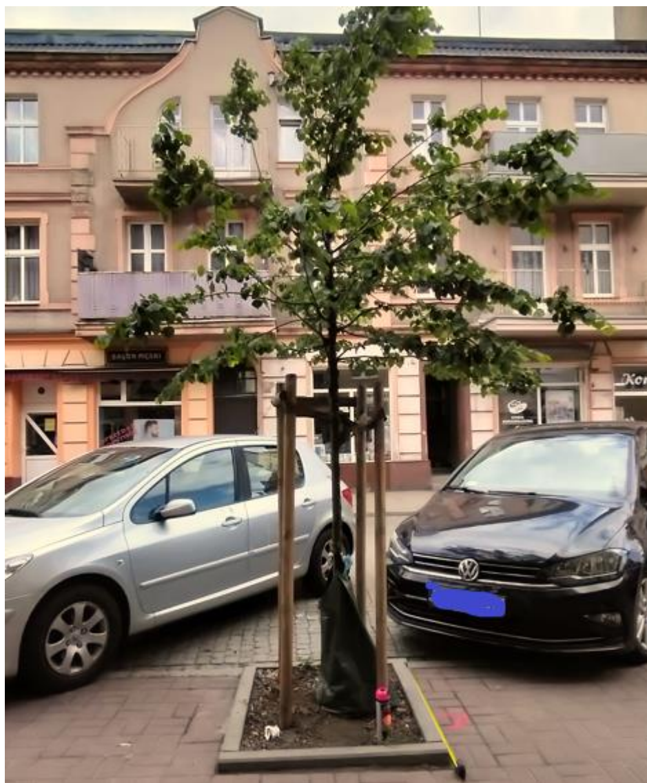
Rysunek 2. Przykład montażu obrzeży krawężnikowych o wym. 100x20x6 cm kolor jasny szary.

Zakres II - Dostawa i montaż 28 szt. obrzeży krawężnikowych o wymiarach 100 cm x 20 cm x 6 cm pod nowe nasadzenia 7 drzew.