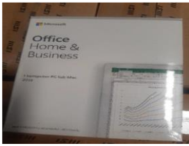
Rys. 3 Przykładowe zdjęcie pudełka dla produktu Microsoft Home&Business

Jesteśmy przekonani, że dzięki takiemu zapisowi do wzoru umowy Zamawiający otrzyma od potencjalnego Wykonawcy w pełni oryginalne oprogramowanie zgodne z warunkami licencjonowania producenta oprogramowania.