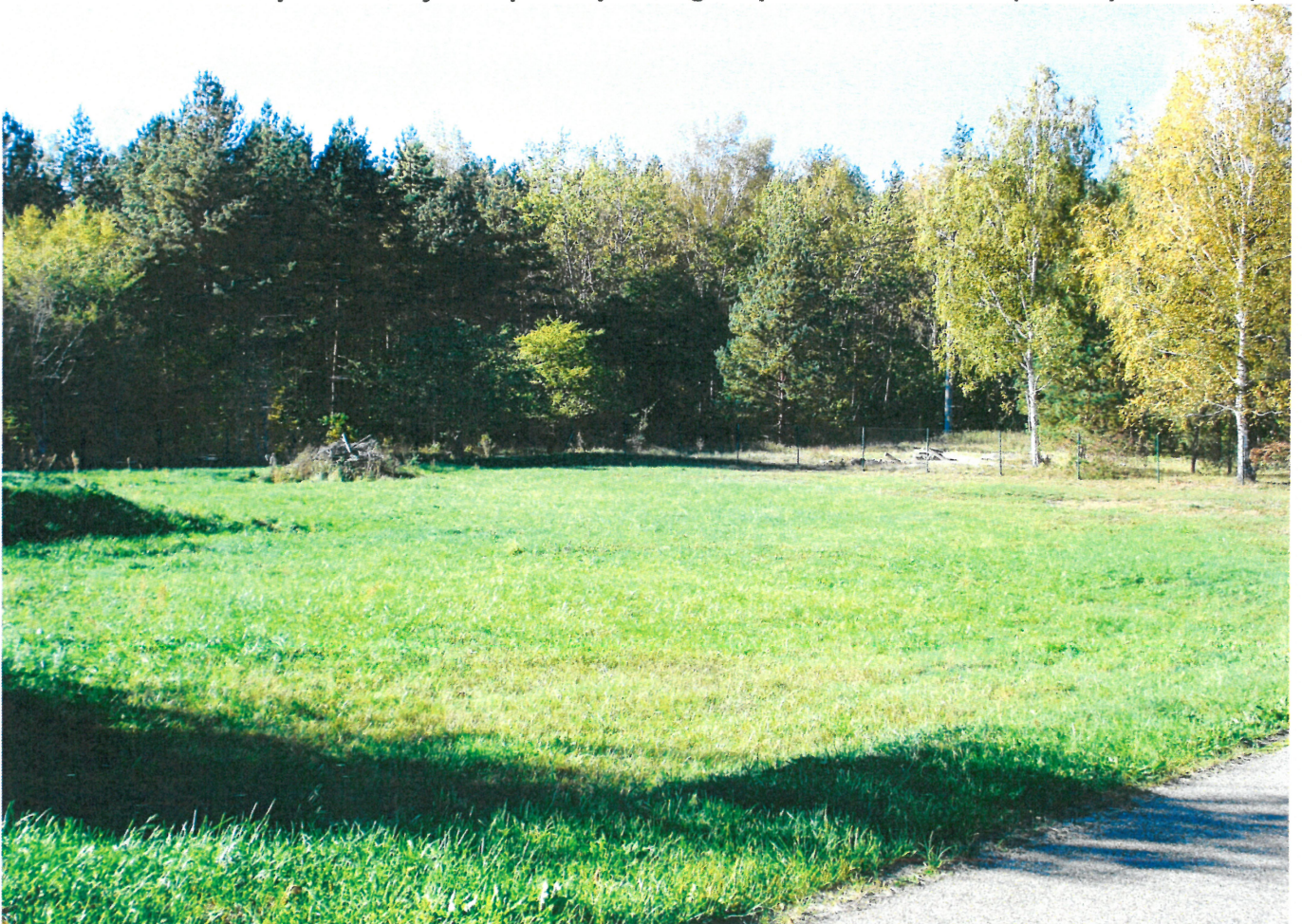
Przewidywany teren umiejscowienia paneli PV (za bud. wyluszczeni nasion)