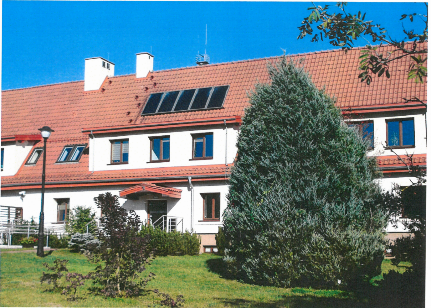
Widok ściany frontowej bud. siedziby n-ctwa (od str pld.-zach.)