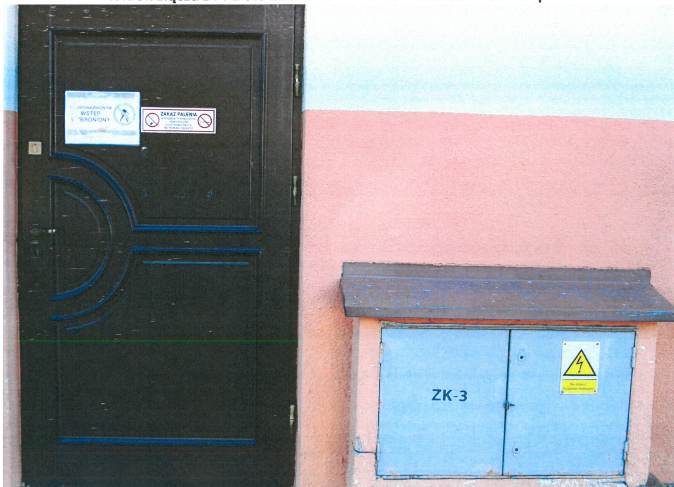
Widok złącza z PPE dla b. wyluszc. nasion, warszt.-garaż. i świetlicy zakł. od str. ptn.-wsch.