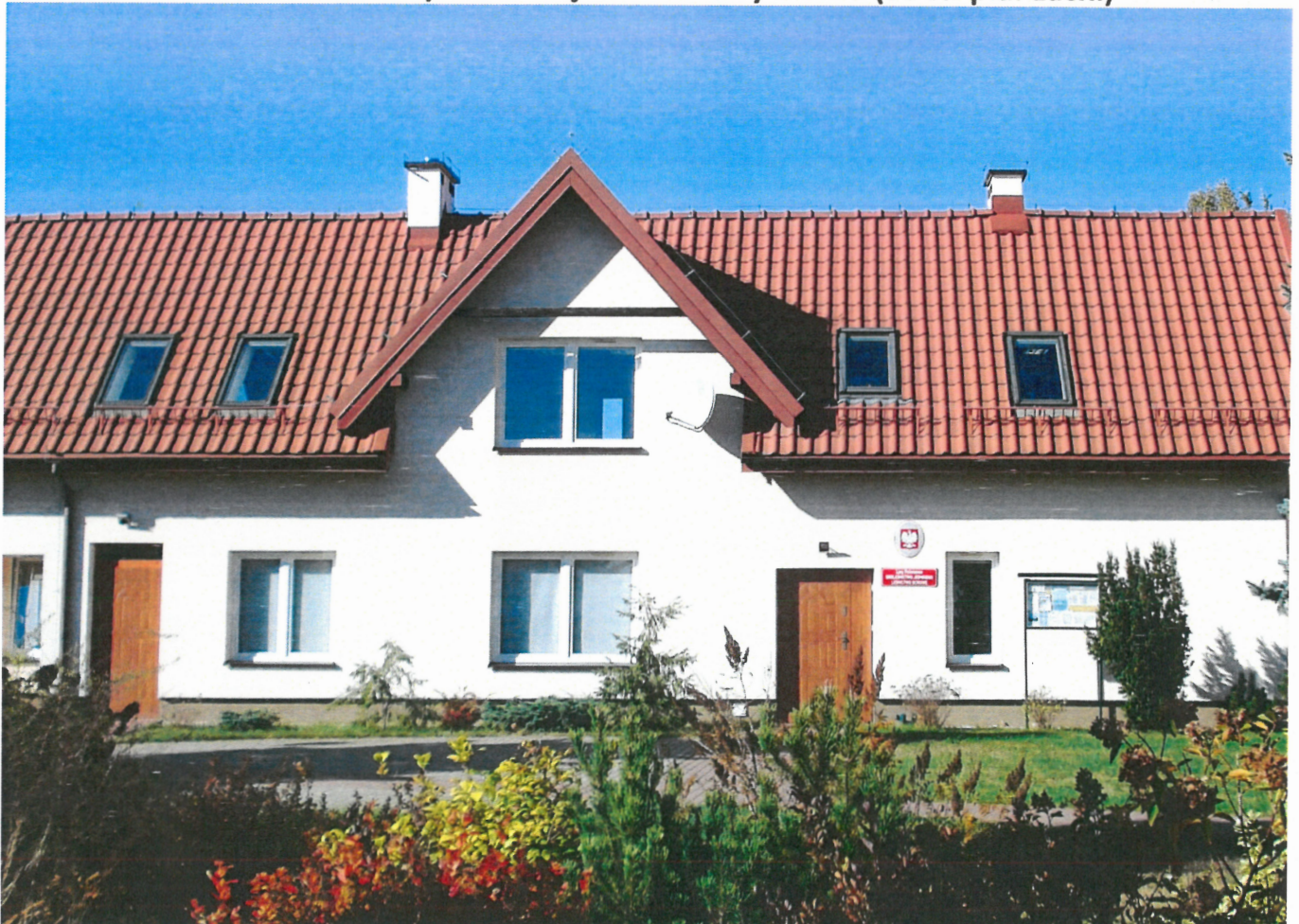
Widok ściany frontowej bud. admin. (od str. pld.-wsch.)