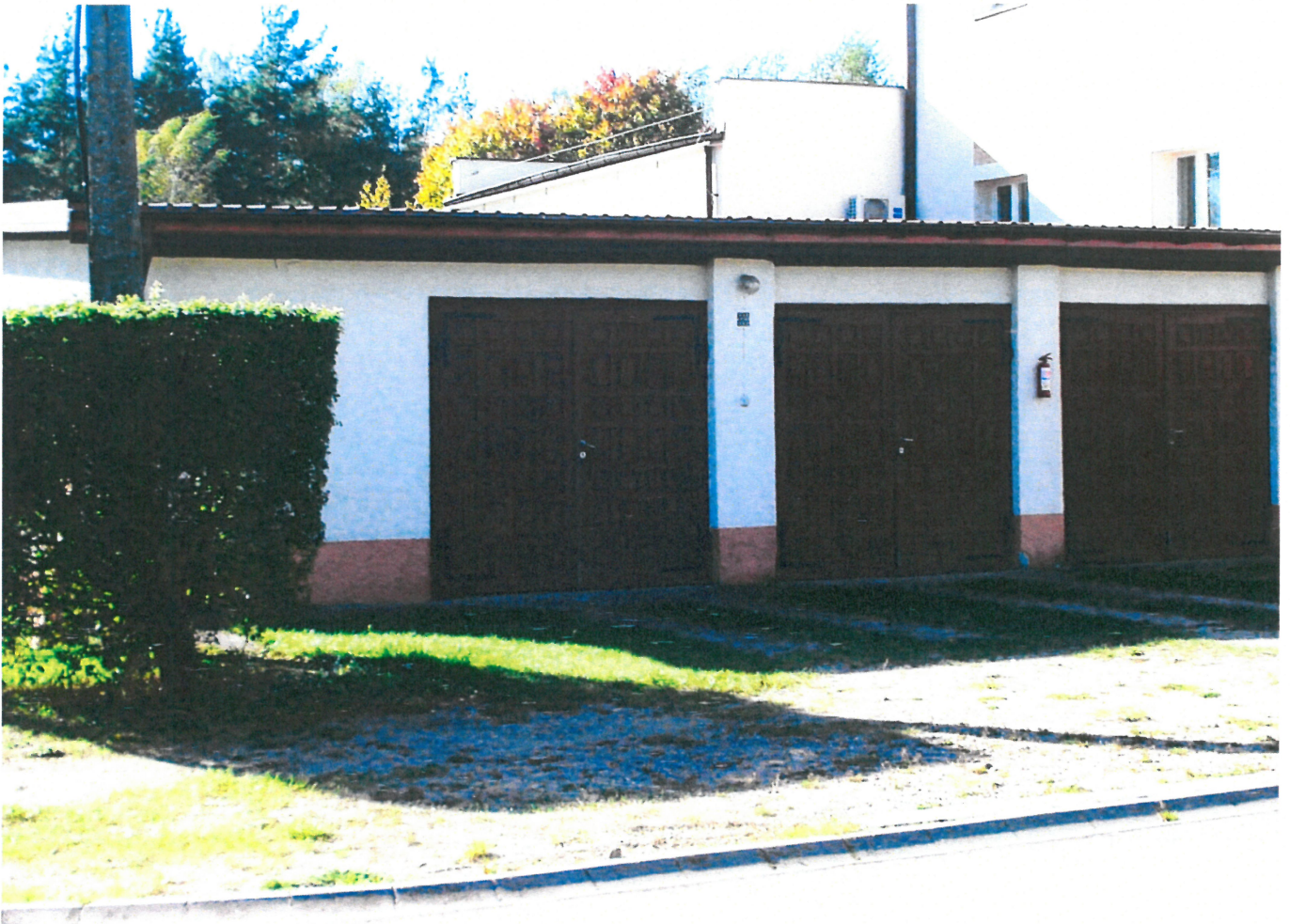
Widok ściany frontowej bud. warszt.-garaż. (od str. ptn.-wsch.)