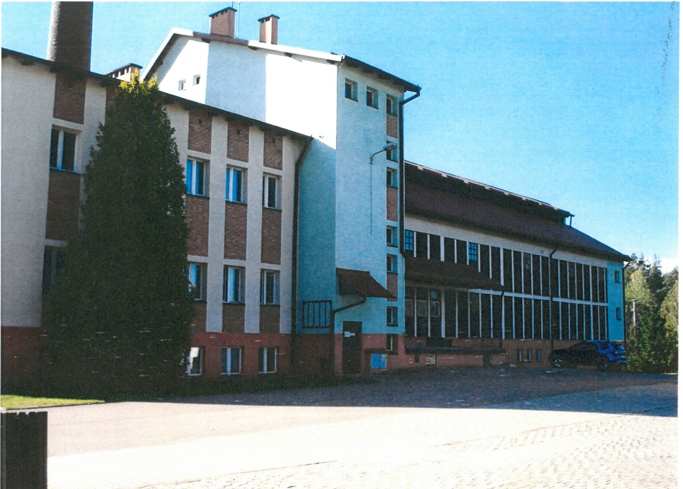
Widok ściany frontowej bud. przemysłowego wyluszczeni nasion (od str pñn.-wsch.)