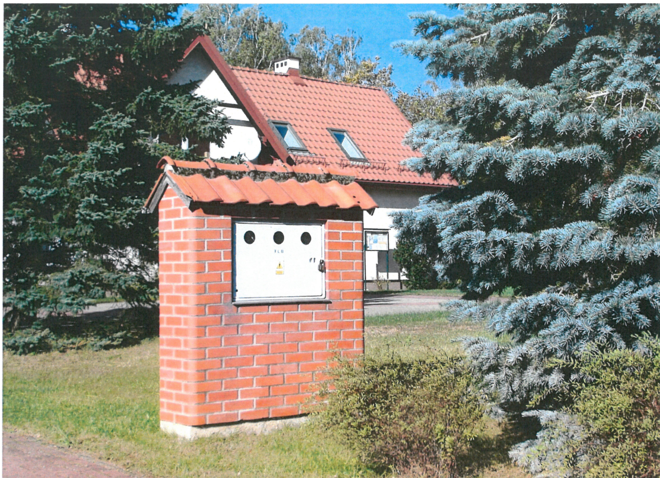
Widok złącza z PPE dla bud. siedz. n-ctwa i bud. adm. od str. pld.-wsch.