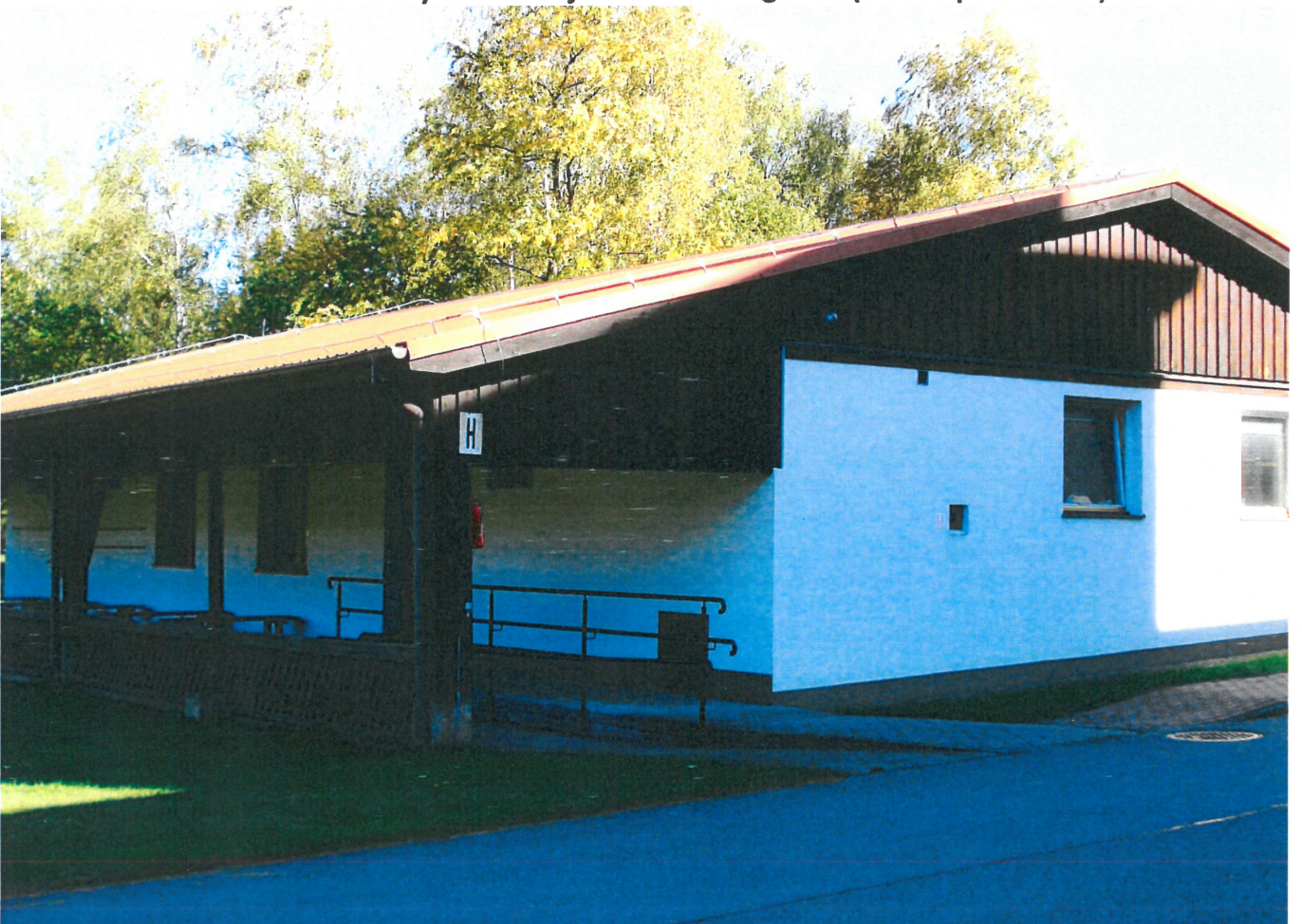
Widok ściany szczytowej i podłużnej bud. świetlicy zakładowej (od str. zach.)