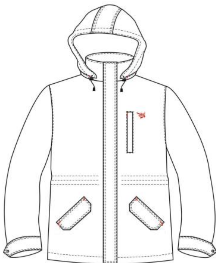
Rys. 1 Przód kurtki

Kurtka w wersji damskiej - zastosować wymiarowanie ciała według sylwetki damskiej oraz taliowanie.