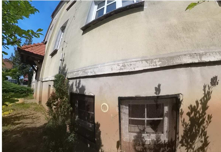
Fot. nr 9-15. Stan istniejący elewacji frontowej – elewacja zachodnia budynku.