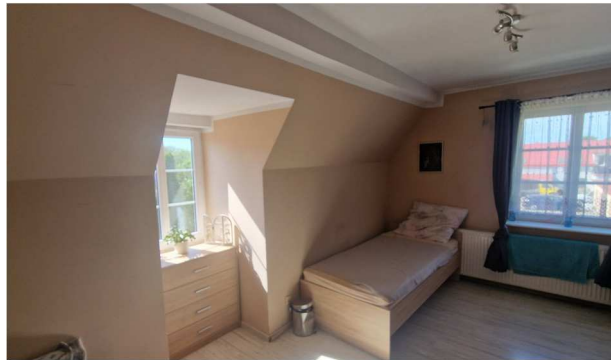
Fot. nr 34. Stan istniejącej zabudowy poddasza budynku.