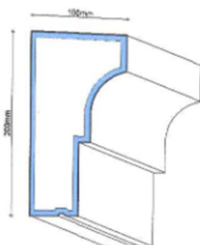
Fot. nr 41.Kształt projektowanego gzymsu okapowego.

7) montaż gzymsów – wszystkie gzymsy, które będą wymagały usunięcia na etapie wykonywania elewacji należy odtworzyć. Projektuje się gzyms okapowy malowany farbą silikonową w kolorze 16012 wg wzornika StoDesign;