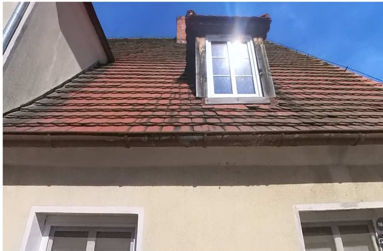
Fot. nr 16. Stan istniejący pokrycia dachu, widok na jedną z lukarn dachowych.