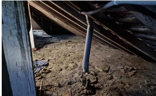
Fot. nr 38. Stan istniejący pionów kanalizacyjnych w poziomie strychu.