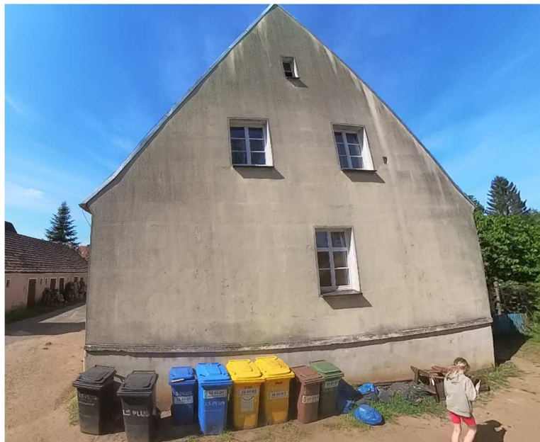
Fot. nr 17. Stan istniejący elewacji południowej budynku.