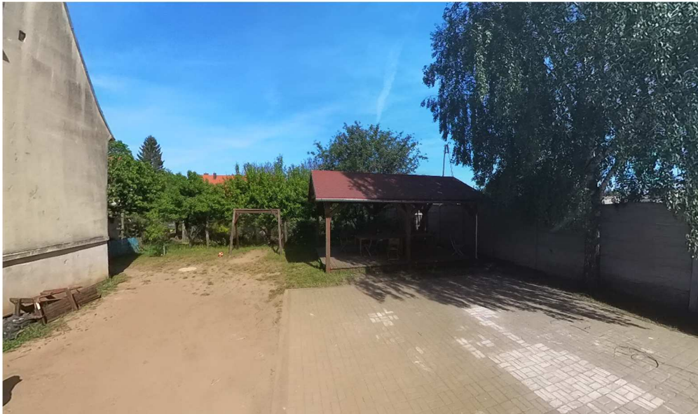
Fot. nr 1-9. Widok na istniejące zagospodarowanie działki.