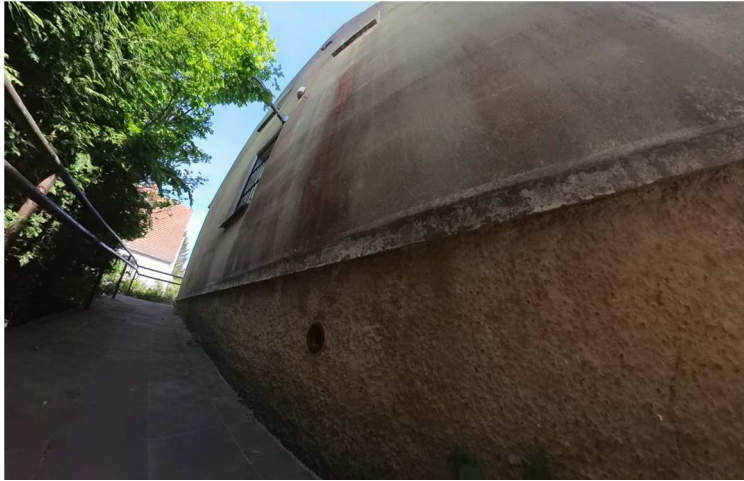
Fot. nr 18. Stan istniejący elewacji od strony północnej.