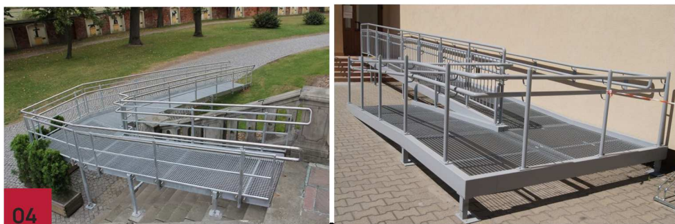
Fot. nr 28 i 29. Przykładowy wygląd pochylni dla osób z niepełnosprawnościami.

Pod rzutem pochylni dla niepełnosprawnych należy wykonać nawierzchnię z żwiru płukanego, ułożonego na geowłókninie.