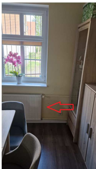
Fot. nr 37. Grzejnik do przeniesienia w pomieszczeniu w poziomie parteru.