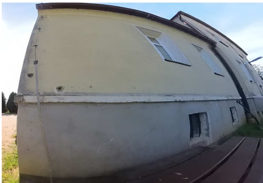
Fot. nr od 22 do 27. Elewacja wschodnia budynku Domu Dziecka.