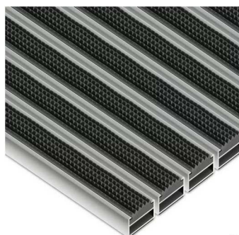
Fot. nr 42. Przykładowy wygląd wycieraczki zewnętrznej do zaprojektowania i wykonania.

W miejscach wskazanych na rzucie parteru przed wejściami zastosować wycieraczki gumowe. Zaprojektowano maty gumowe o strukturze ażurowej o wysokości 22 mm, wykonane z wysokiej jakości trudno ścieralnej gumy odpornej na skrajne warunki atmosferyczne. Maty należy zamontować we wnękach głębokości 22 mm ograniczonych systemowymi, nierdzewnymi kątownikami.