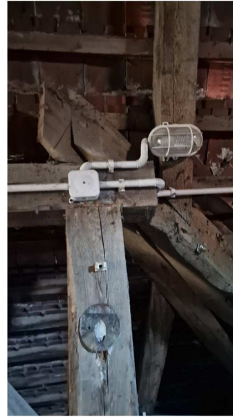
Fot. nr 30 - 33. Istniejące zagospodarowanie strychu, istniejąca konstrukcja dachu.