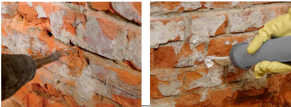
Fot. 39 i 40. Wykonanie hydroizolacji iniekcyjnej przed położeniem tynku renowacyjnego.