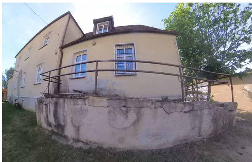
Fot. nr 19, 20 i 21. Elewacja północna oraz część elewacji wschodniej budynku, istniejąca pochylnia dla osób z niepełnosprawnościami.