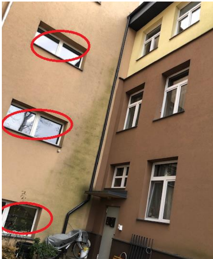
Fot.1: okna na granicy stref pożarowych, podlegające wymianie.