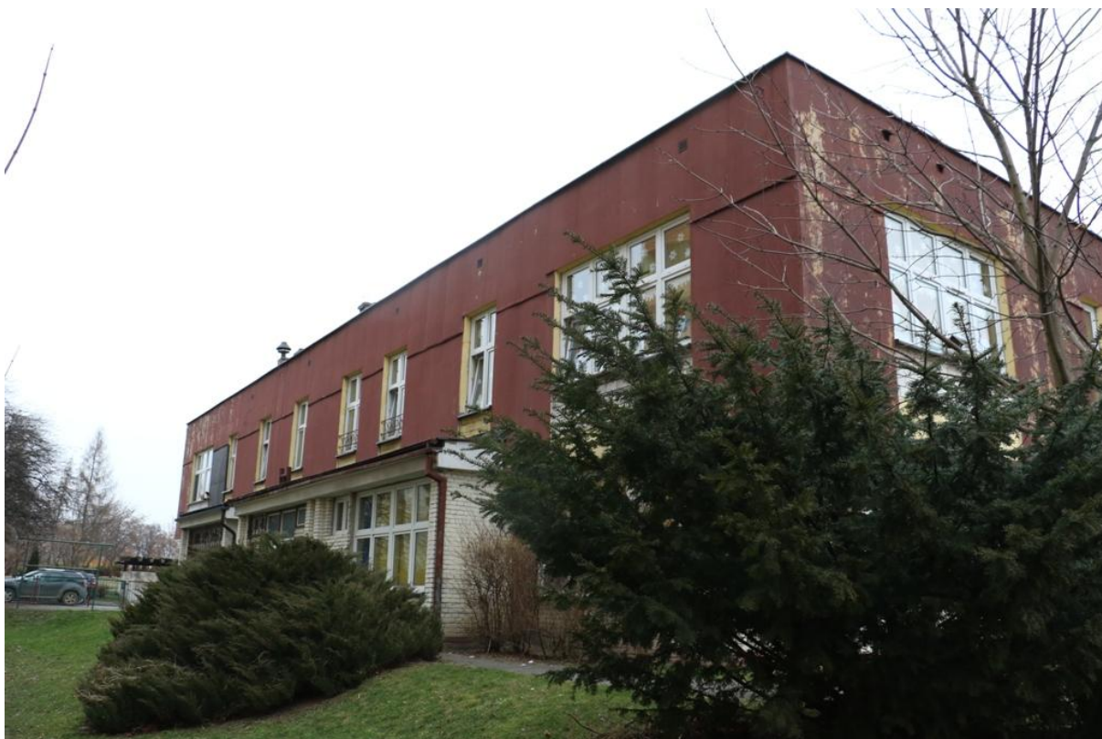
Fot. 5. Piłsudskiego 78, Jaworzno - ściana zachodnia