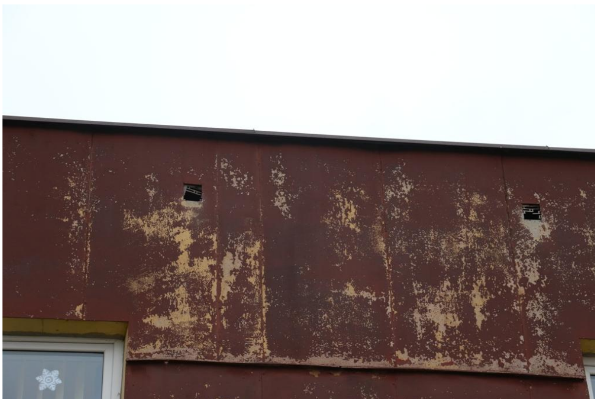
Fot. 9. Piłsudskiego 78, Jaworzno - ściana południowa, potencjalne siedliska