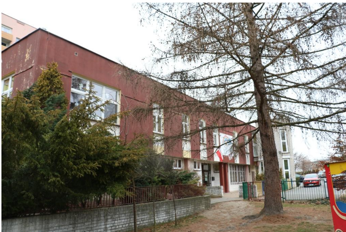
Fot. 3. Piłsudskiego 78, Jaworzno - ściana wschodnia