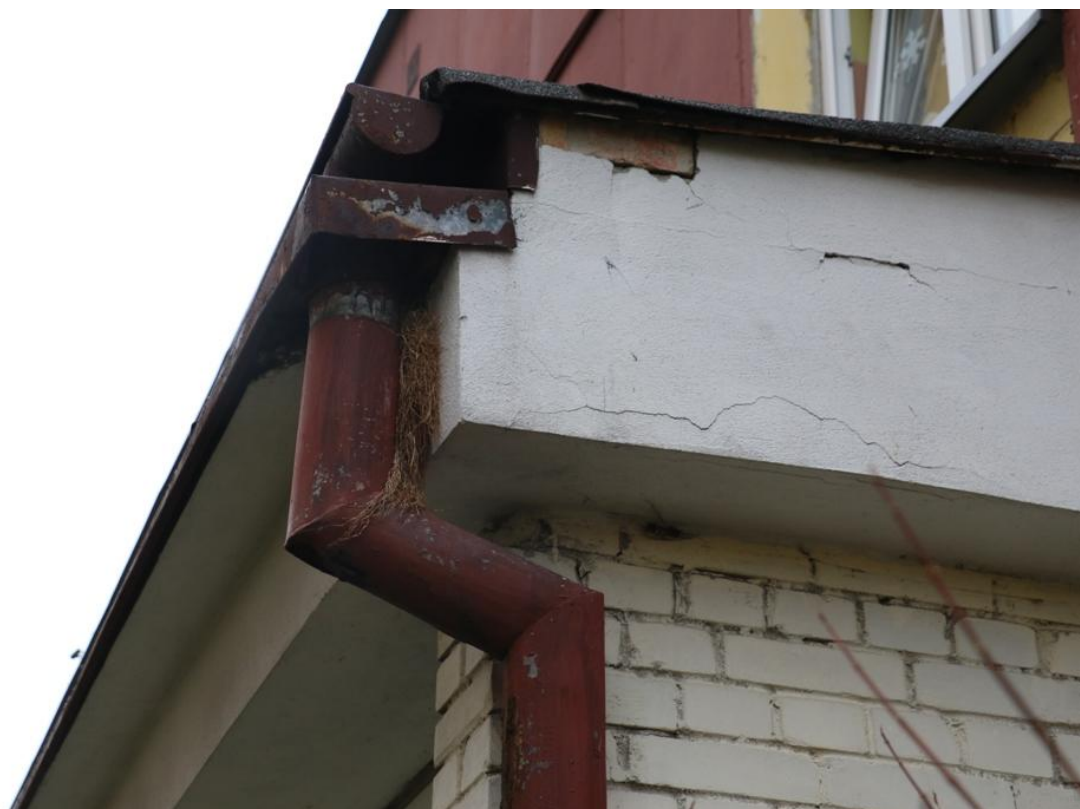
Fot. 7. Piłsudskiego 78, Jaworzno - ściana zachodnia, potencjalne siedlisko