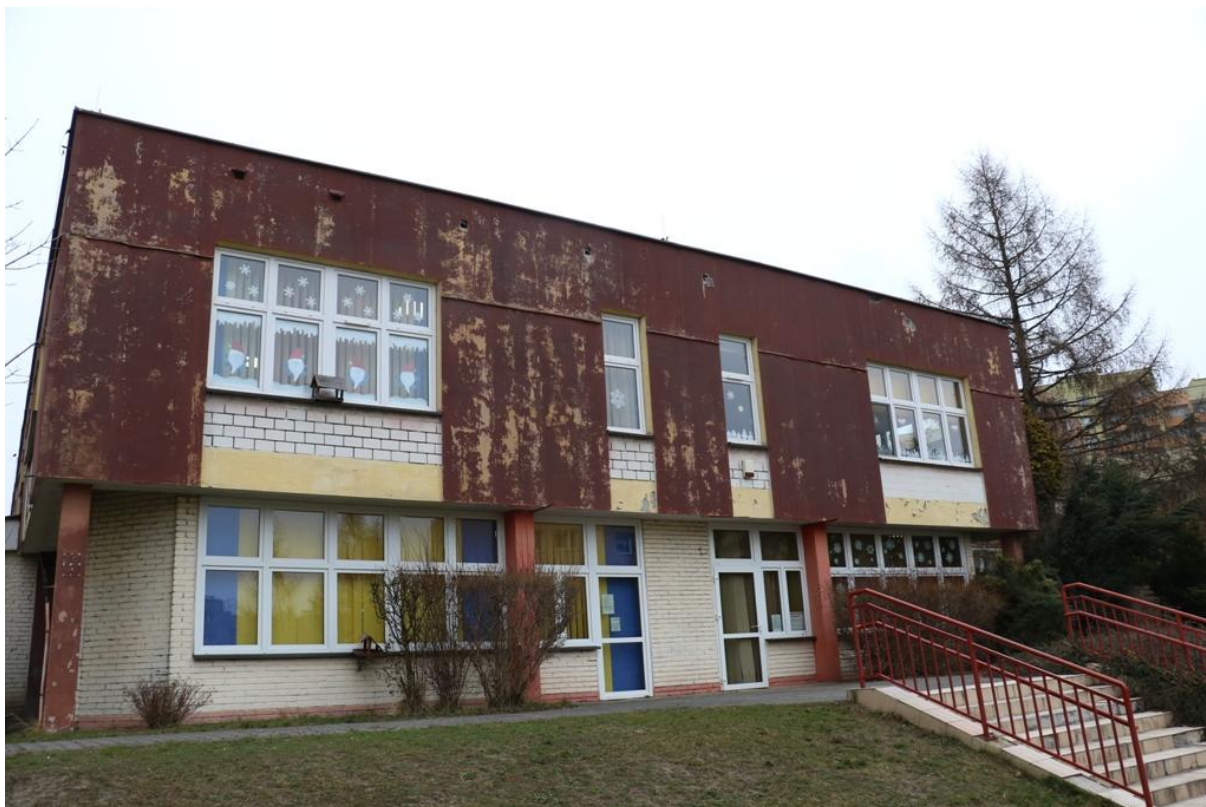
Fot. 4. Piłsudskiego 78, Jaworzno - ściana południowa