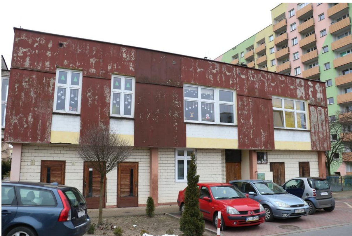
Fot. 2. Piłsudskiego 78, Jaworzno - ściana północna