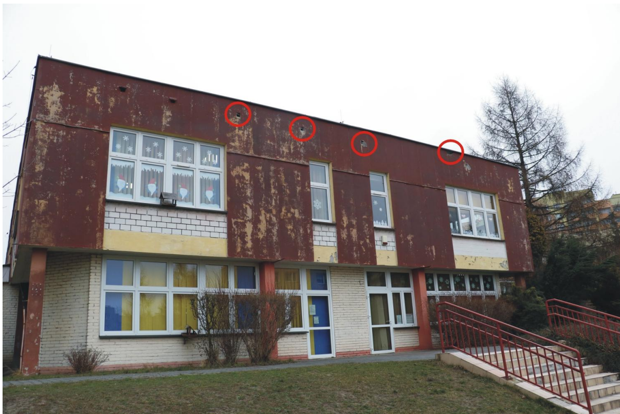
Fot. 8. Piłsudskiego 78, Jaworzno - ściana południowa, potencjalne siedliska