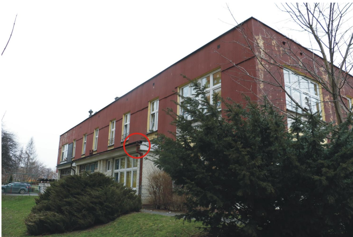
Fot. 6. Piłsudskiego 78, Jaworzno - ściana zachodnia, potencjalne siedlisko