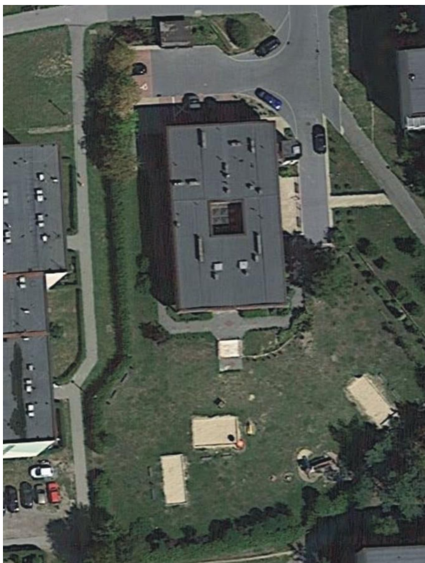
Fot. 1. Budynek przy ulicy Piłsudskiego 78 w Jaworznie

Inwentaryzowany obiekt to dwukondygnacyjny budynek przedszkolny.