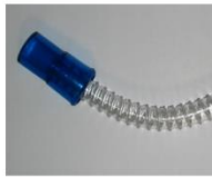
Odłączalny trójnik od rur

Pytanie nr 56 Pakiet nr 48 poz. 3 Prosimy o wydzielenie z pakietu poz. 3 Linia próbkująca do defibrylatora Lifepack. Proszę swą motywujemy tym iż jest tylko jeden producent który posiada w ofercie ten produkt.