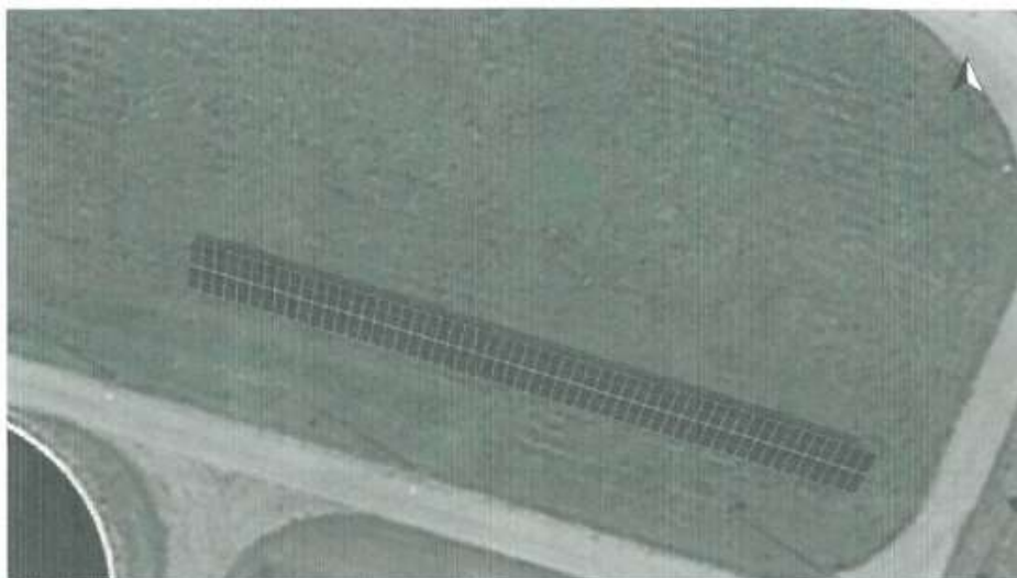
Ilustracja: Obraz przeglad, Projektowanie 3D

Lokalizacja istniejącej instalacji fotowoltaicznej 49,5 kWp na dz. nr 58/9 m. Chwałkowo.