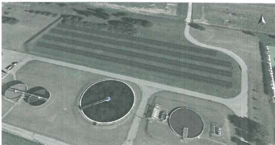
Ilustracja: Zrzut ekranu01