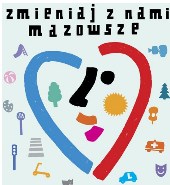
Rysunek 7 Plakat promujący BOM.