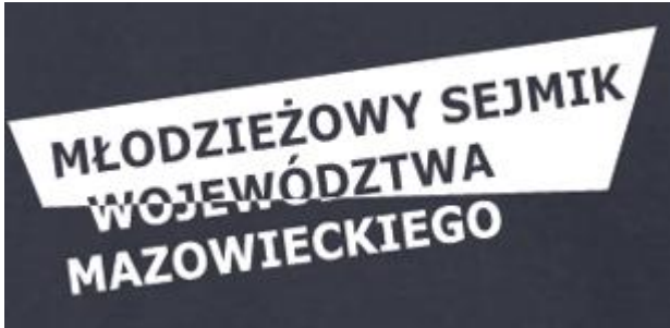
Rysunek 5 Poglądowy nadruk reklamowy z hasłem – Młodzieżowy Sejmik Województwa Mazowieckiego.