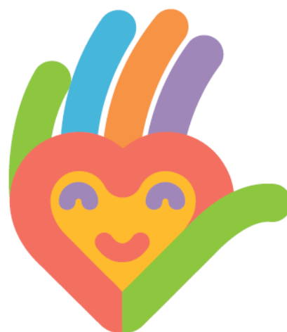
Rysunek 8 Logo Mazowieckie Bary Wolontariatu.