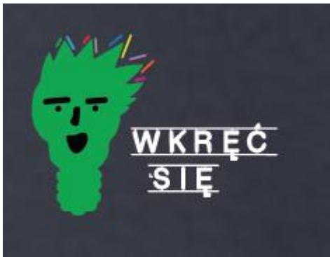
Rysunek 4 Poglądowy nadruk reklamowy z żarówką i napisem – wkręć się.