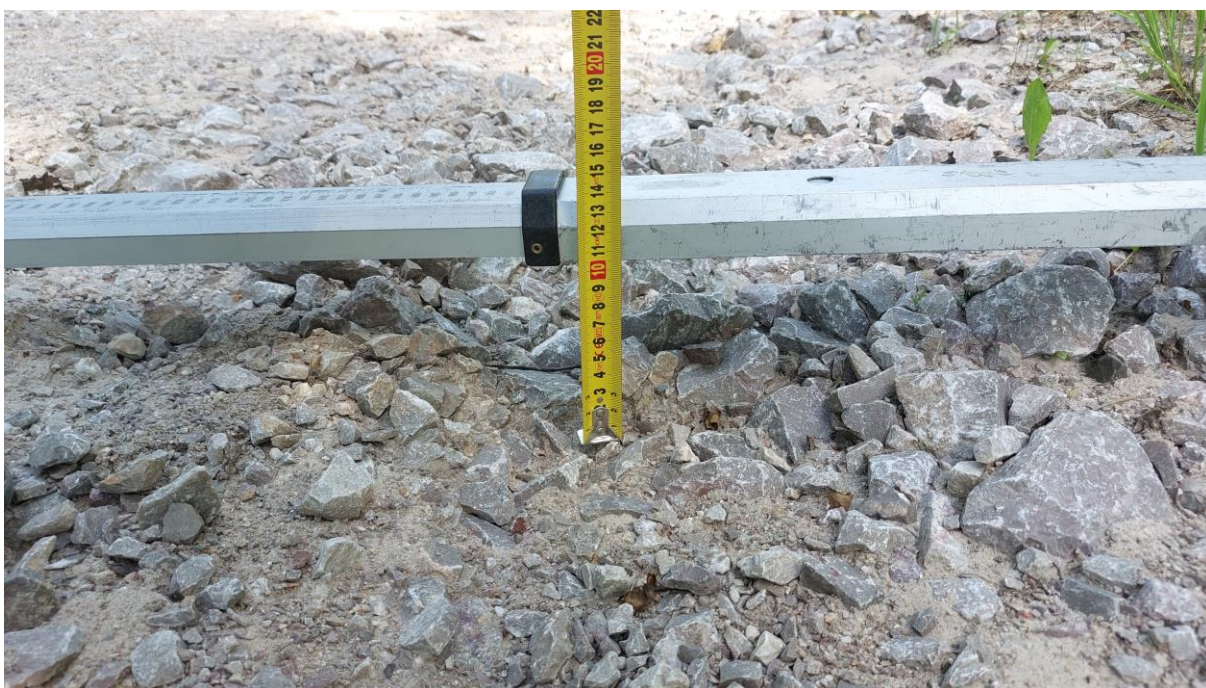
Zdjęcie 4. Szczegół rozmycia do zdjęcia poglądowego nr 2.