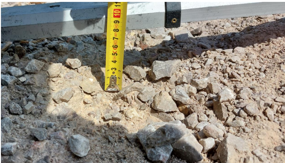
Zdjęcie 2. Szczegół rozmycia do zdjęcia poglądowego nr 1