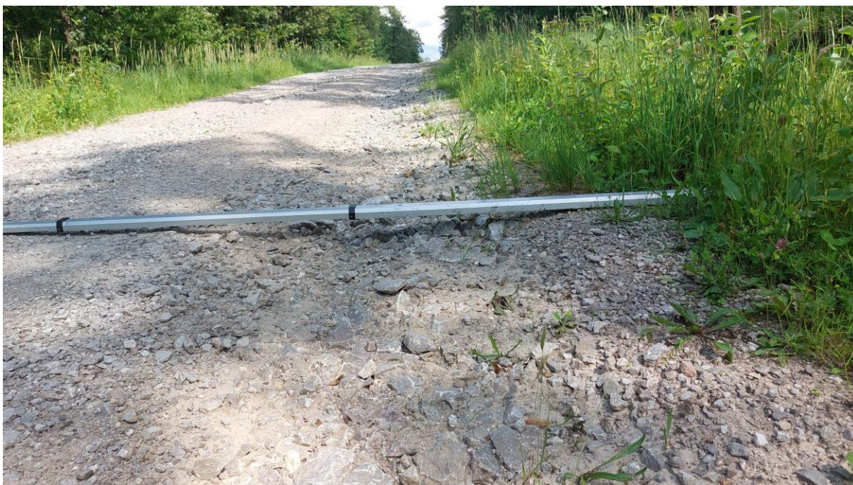
Zdjęcie 3. Zdjęcie poglądowe nr 2 - rozmyta nawierzchnia jezdni