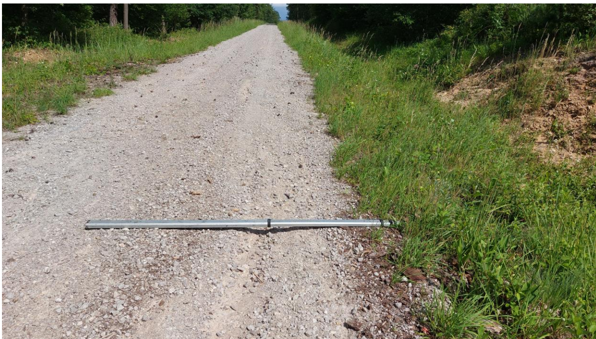
Zdjęcie 1. Zdjęcie poglądowe nr 1 - rozmyta nawierzchnia jezdni

Dokumentacja fotograficzna przedstawiająca stan istniejący nawierzchni drogi leśnej, która została rozmyta w wyniku silnych opadów deszczu.