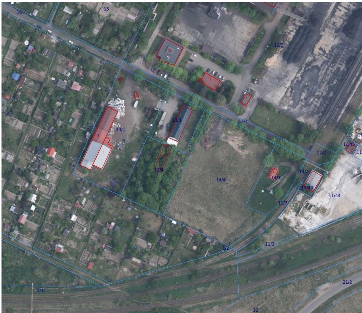
Rysunek 1. Planowany teren inwestycji – dz. nr 14/4.

Planowana Kotłownia na biomasę zostanie zlokalizowana na działce nr ewid. 14/4, obręb AM37 w Oleśnicy przy ul. Ciepłej. Tytuł prawny do działki posiada Gmina Oleśnica. Wieczystym użytkownikiem tego terenu jest MIEJSKA GOSPODARKA KOMUNALNA SPÓŁKA Z O.O. W OLEŚNICY.