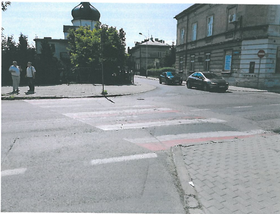
ISTNIEJACE PRZEJŚCIE DLA PIESZYCH UL. ŚW. JANA NEPOMUCENA W PRZEMYŚLU