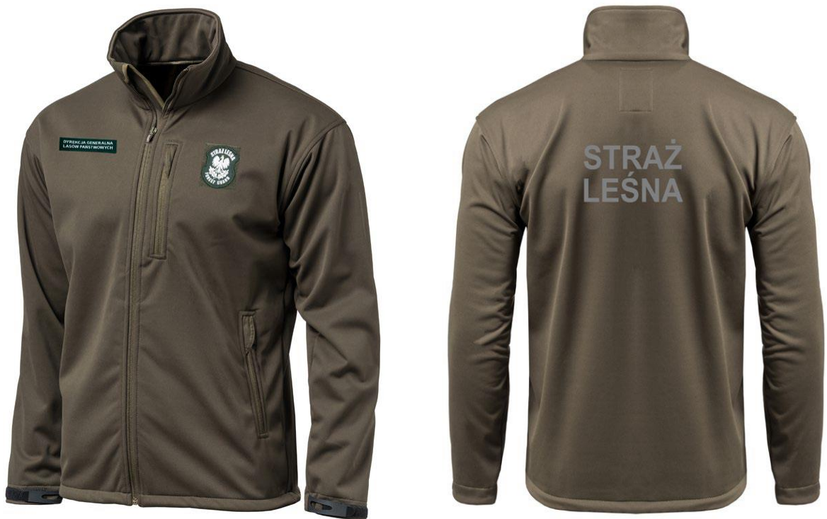
Bluza typu softshel