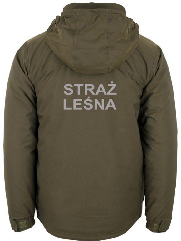
Kurtka ocieplana z podpinką