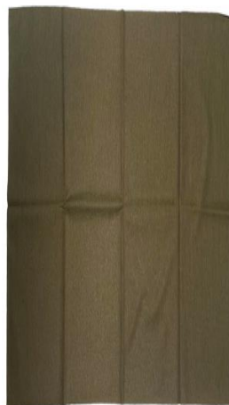
Szalik – chusta wielofunkcyjna – komin