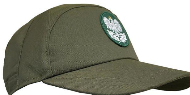
Czapka przeciwdeszczowa z daszkiem