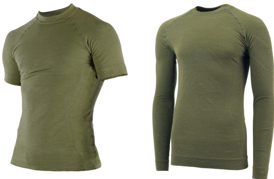
Koszulka termoaktywna krótki i długi rękaw