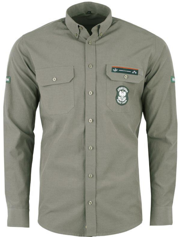
Koszule robocze krótki i długi rękaw