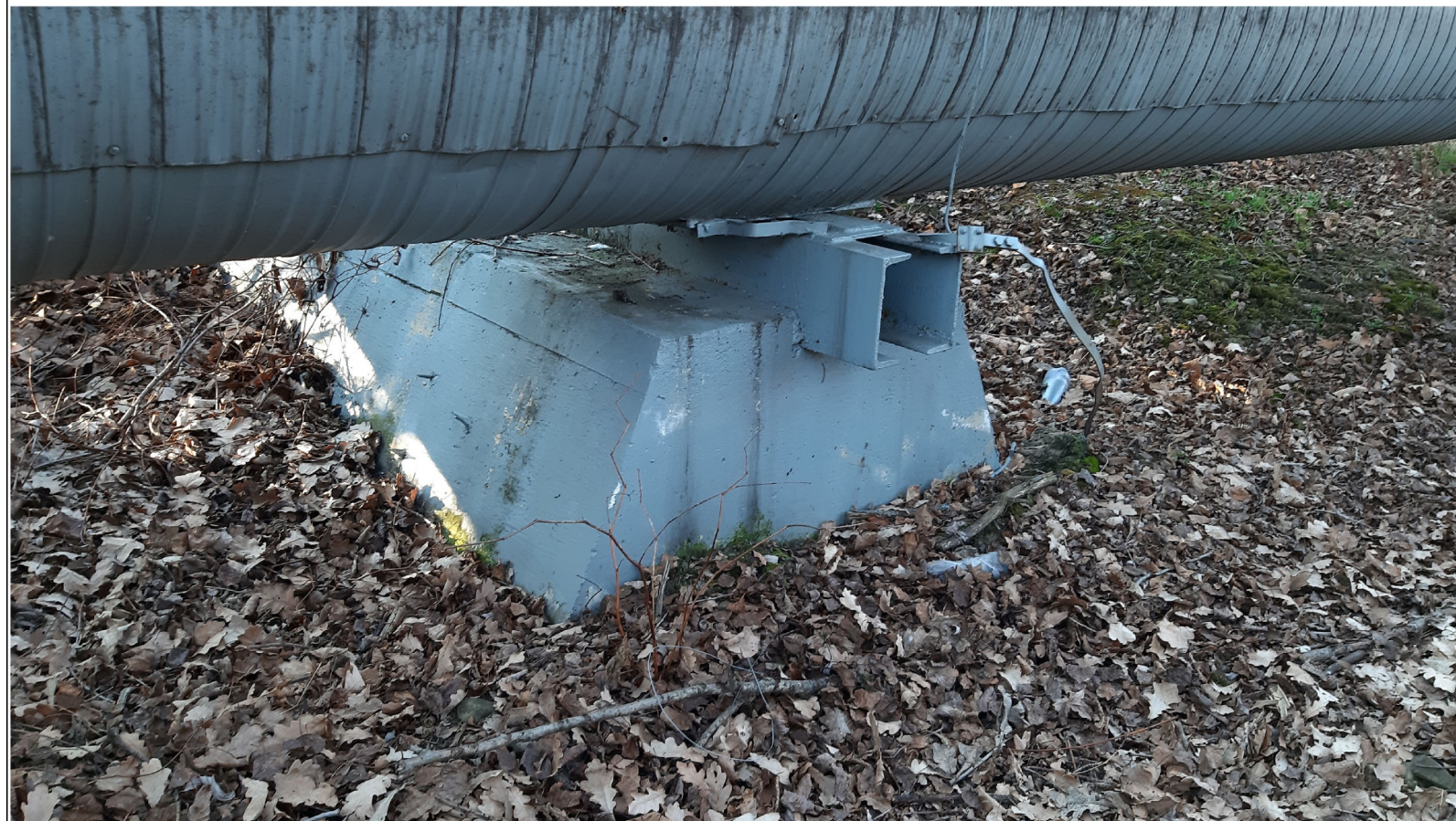
PODPORA ŚLIZGOWA P-99