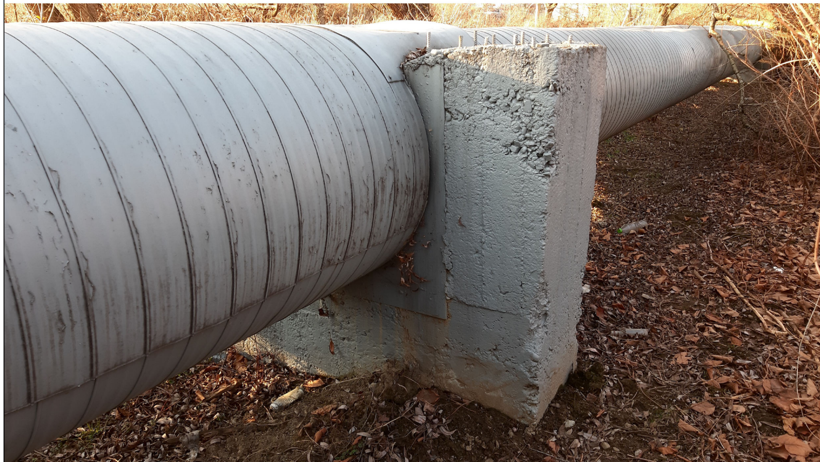
PUNKT STAŁY PS-18