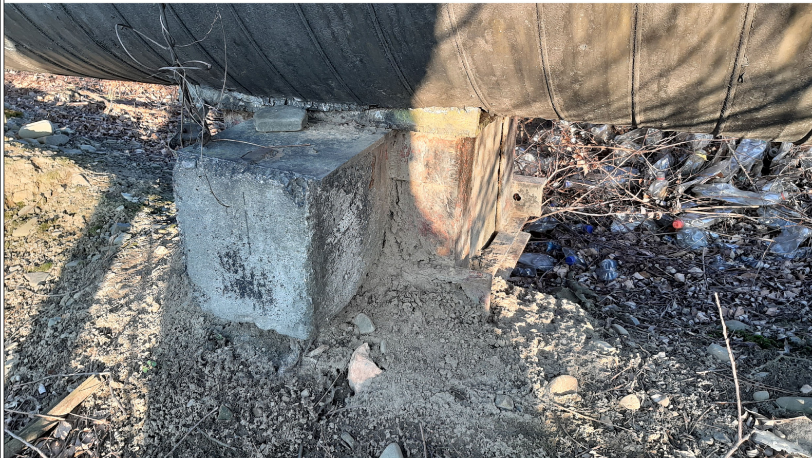
PODPORA ŚLIZGOWA P-87