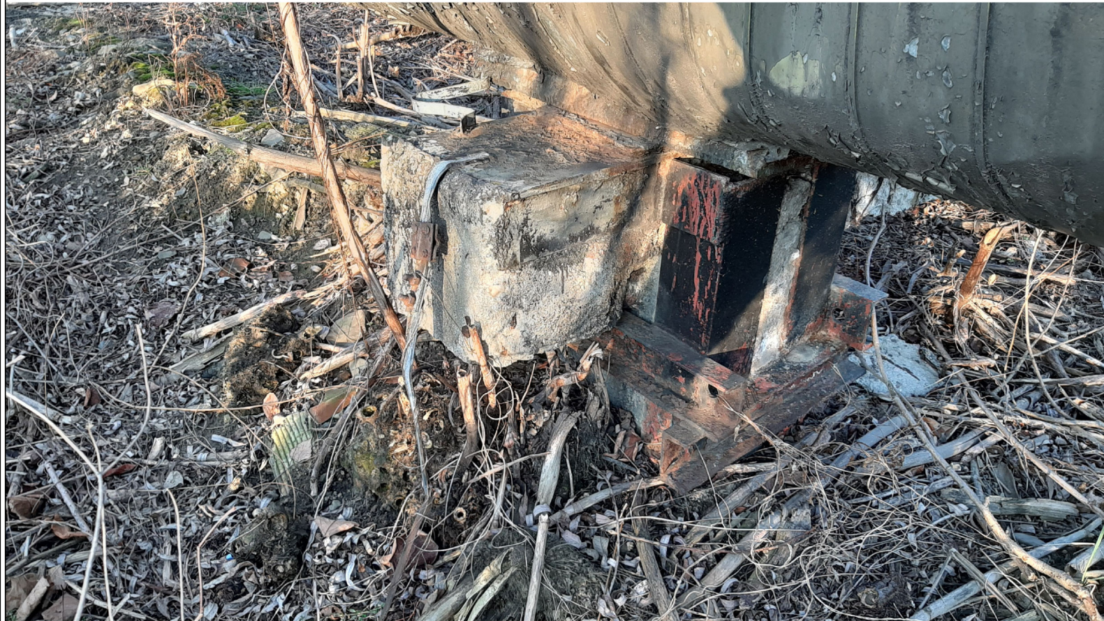
PODPORA ŚLIZGOWA P-85