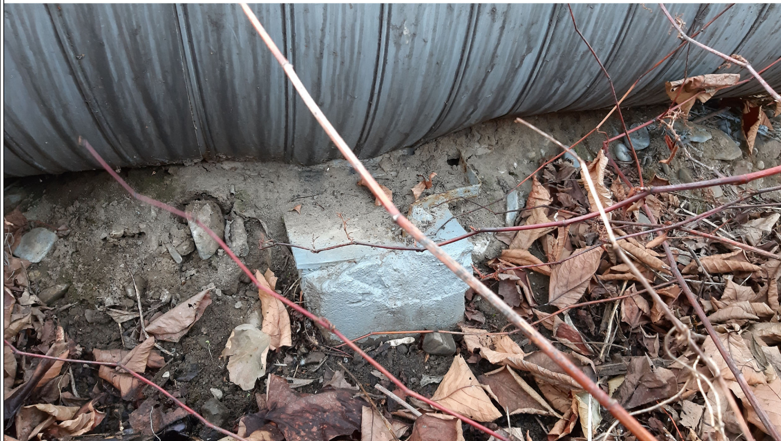
PODPORA ŚLIZGOWA P-95