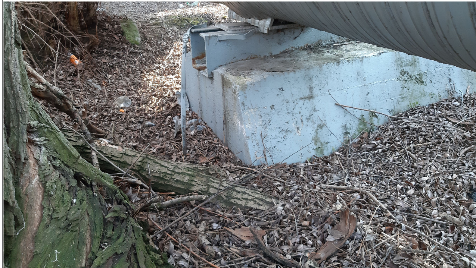
PODPORA ŚLIZGOWA P-98