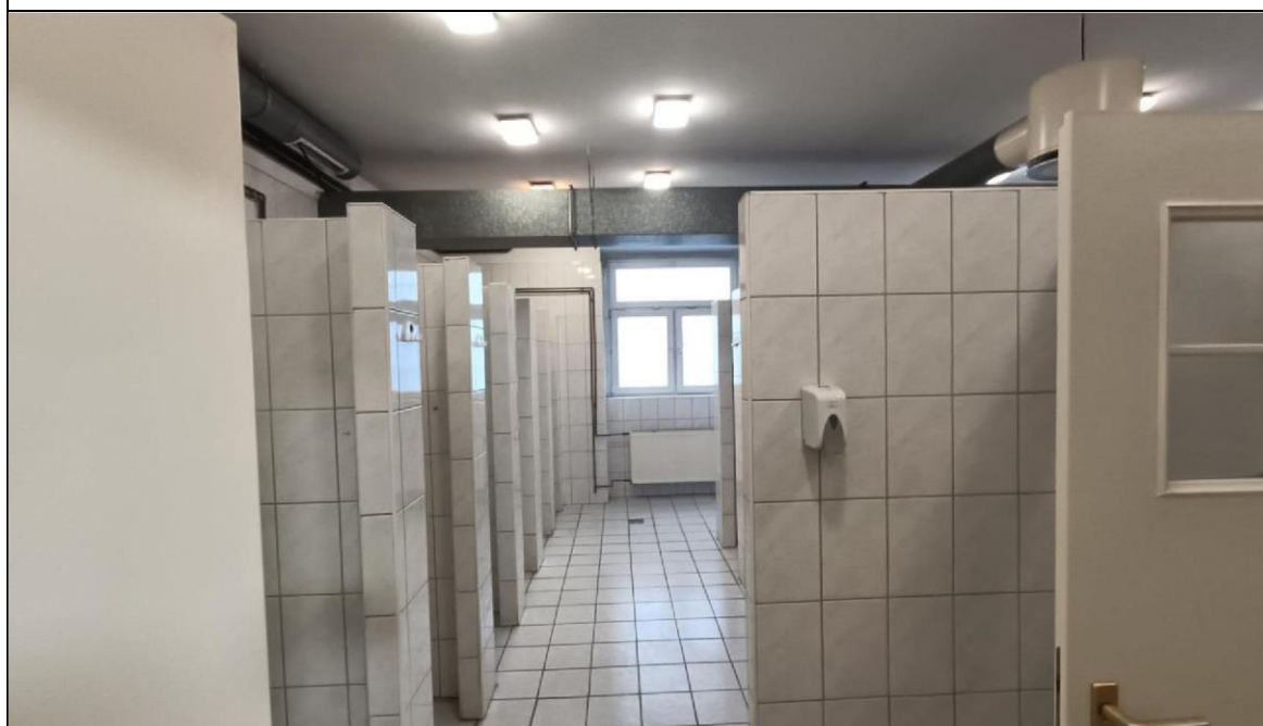
Zdjęcie nr 6 – Budynek przy ul. Witelona 25a. Istniejąca łazienka męska.