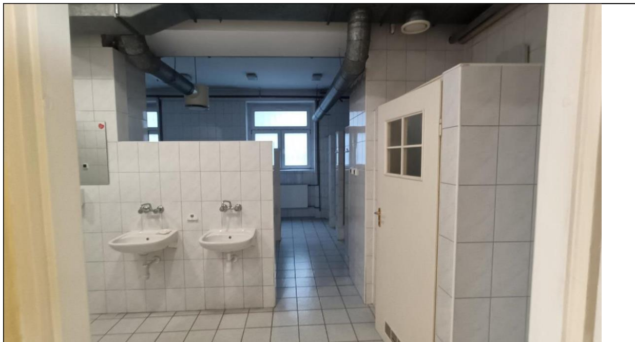
Zdjęcie nr 1 – Budynek przy ul. Witelona 25a. Istniejąca łaźnia damska.