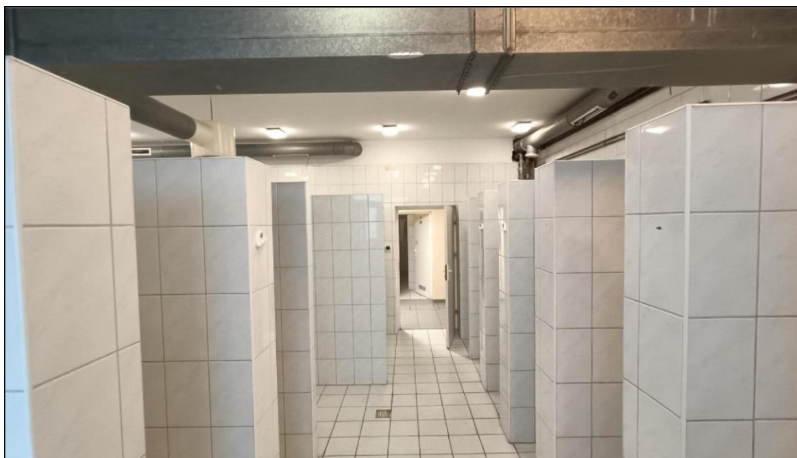
Zdjęcie nr 7 – Budynek przy ul. Witelona 25a. Istniejąca łaźnia męska.