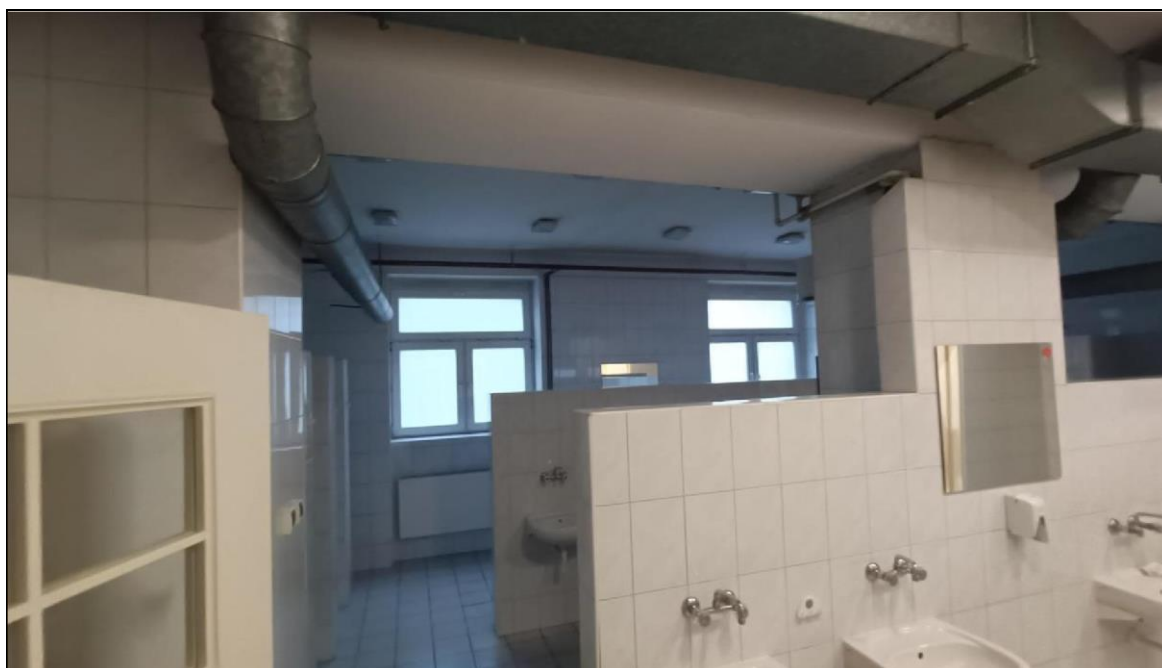
Zdjęcie nr 3 – Budynek przy ul. Witelona 25a. Istniejąca łaźnia damska.