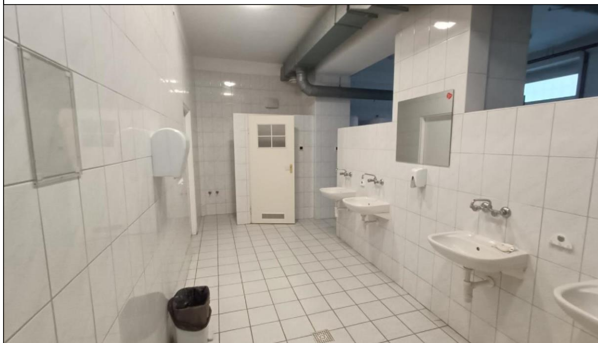
Zdjęcie nr 2 – Budynek przy ul. Witelona 25a. Istniejąca łaźnia damska.