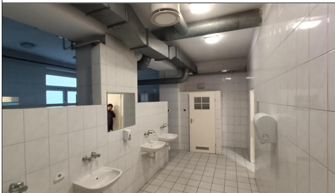
Zdjęcie nr 4 – Budynek przy ul. Witelona 25a. Istniejąca łaźnia damska.