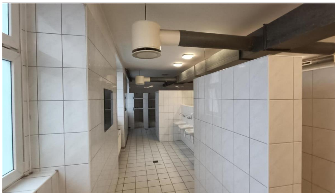
Zdjęcie nr 8 – Budynek przy ul. Witelona 25a. Istniejąca łaźnia męska.