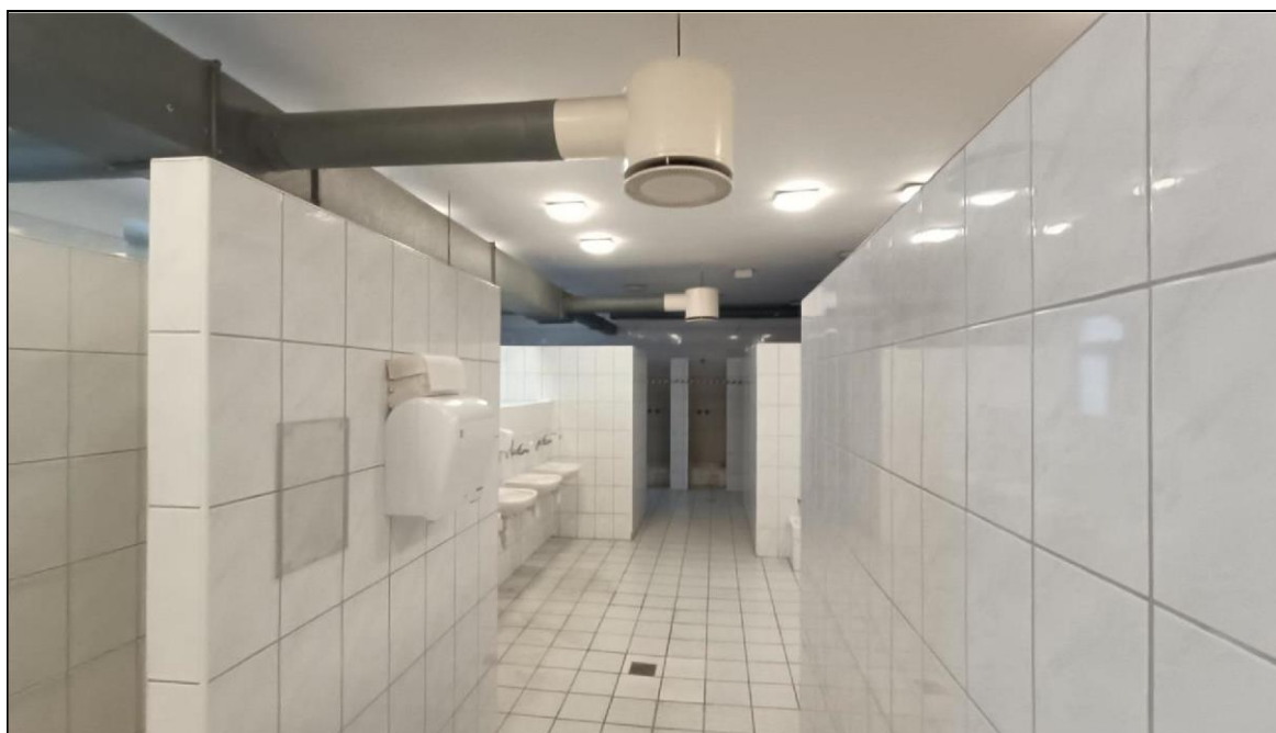
Zdjęcie nr 9 – Budynek przy ul. Witelona 25a. Istniejąca łazienka męska.