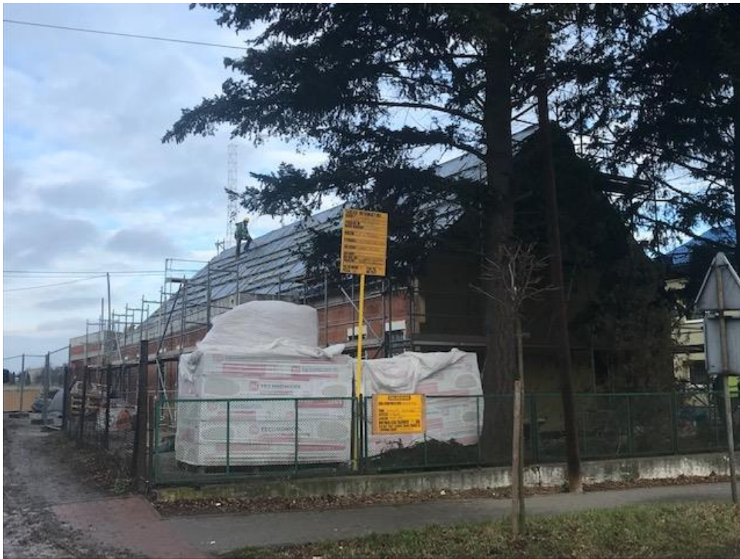
Widok od strony placu budowy