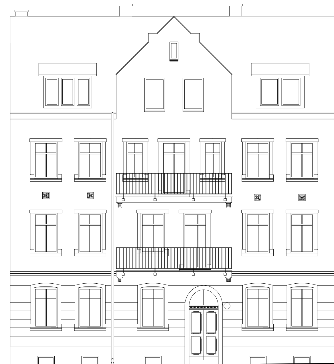
ELEWACJA WSCHODNIA INWENTARYZACJA

Projekt sporządzono przy pomocy oprogramowania Autodesk Autocad LT 2023 Zastrzega się wszelkie prawa wynikające z Ustawy o prawie autorskim. Rysunek niniejszy nie może być w całości lub w części przerysowany, uzupełniony lub odstąpiony komukolwiek, bez pisemnej zgody pracowni.