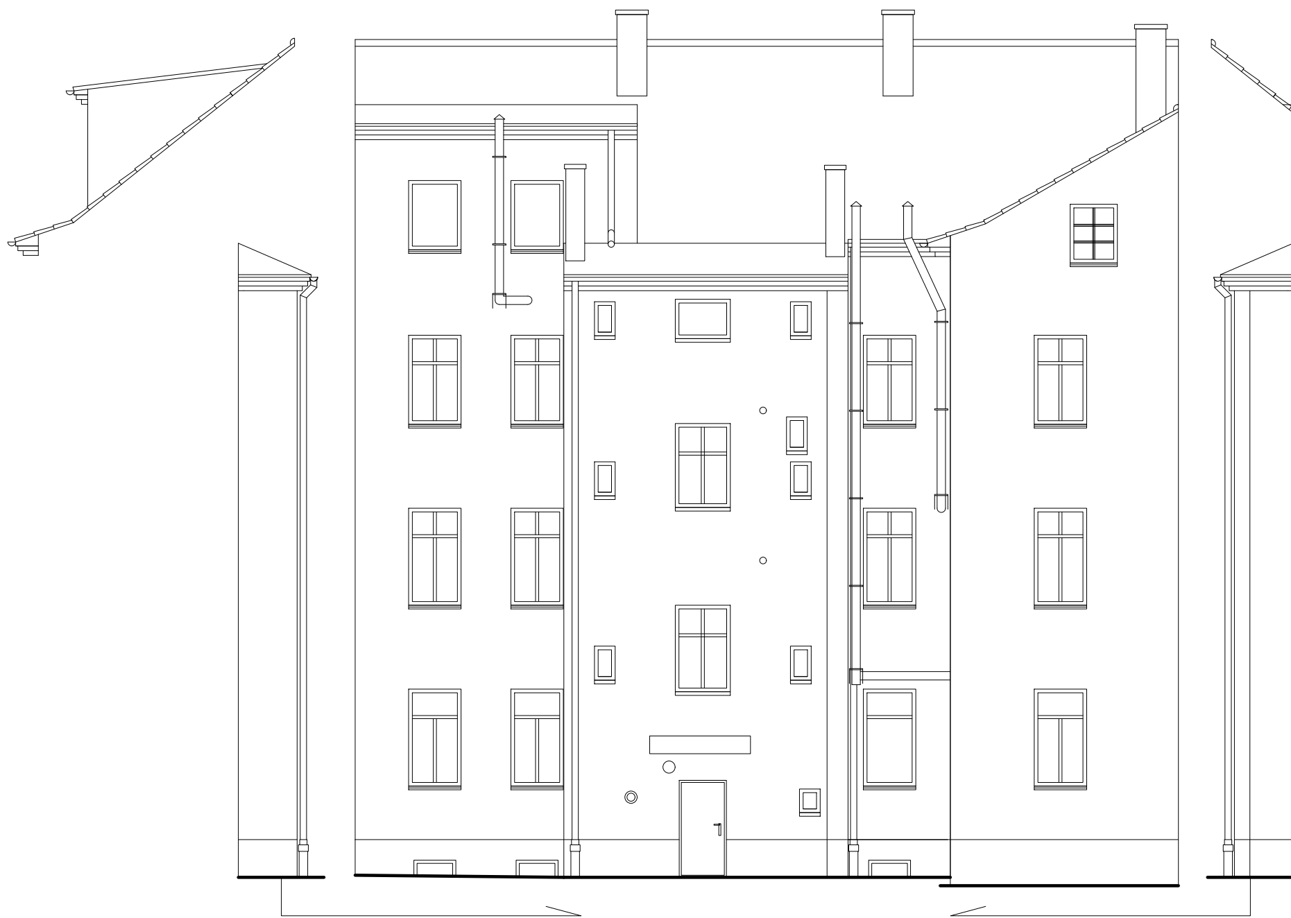
ELEWACJA ZACHODNIA INWENTARYZACJA