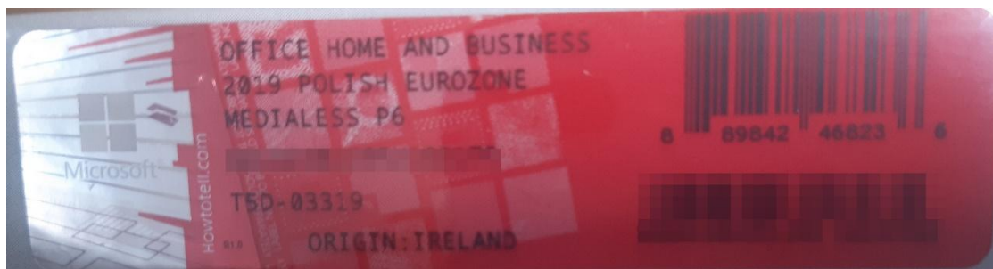
Rys. 2 przykładowy kod zabezpieczony przez producenta systemu Microsoft Windows Office Home&Business z wymazanym, znajdującym się w prawym dolnym rogu numerem seryjnym produktu. Kod licencyjny znajduje się w środku szczelnie zapakowanego i zafoliowanego pudełka (Rys. 3)