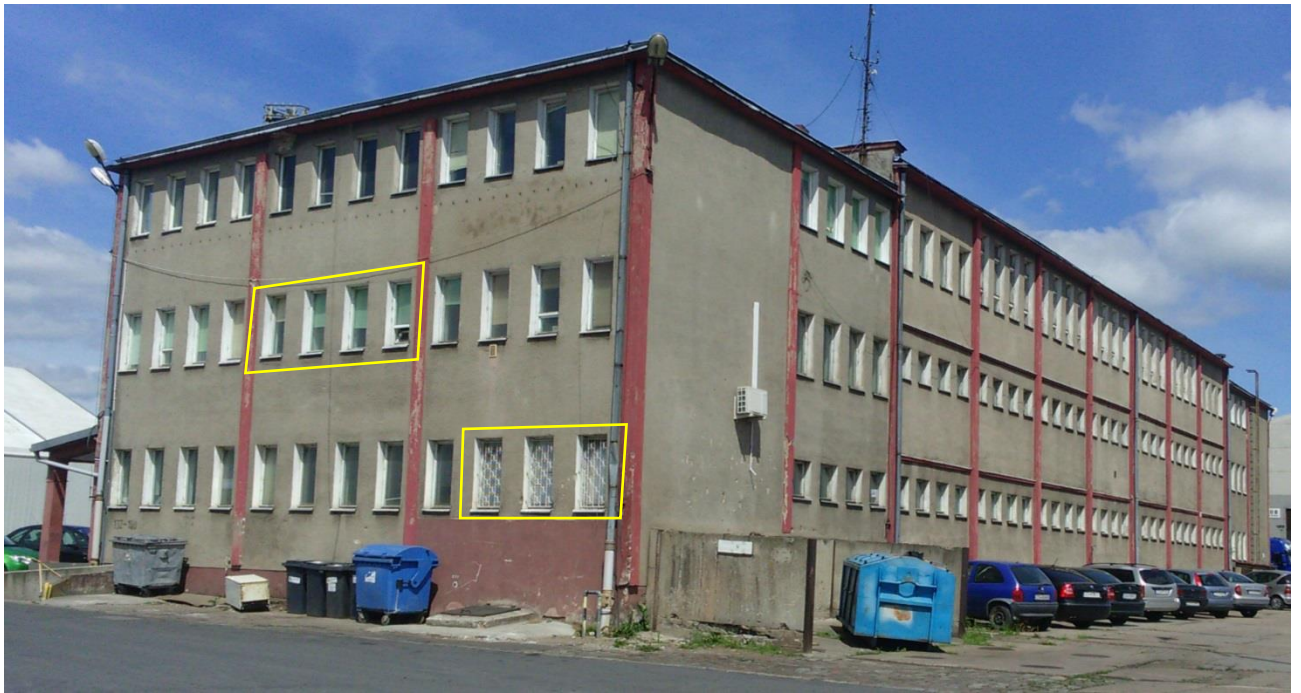
Zdj. 3. Widok elewacji południowej. Zaznaczone okna do wymiany.