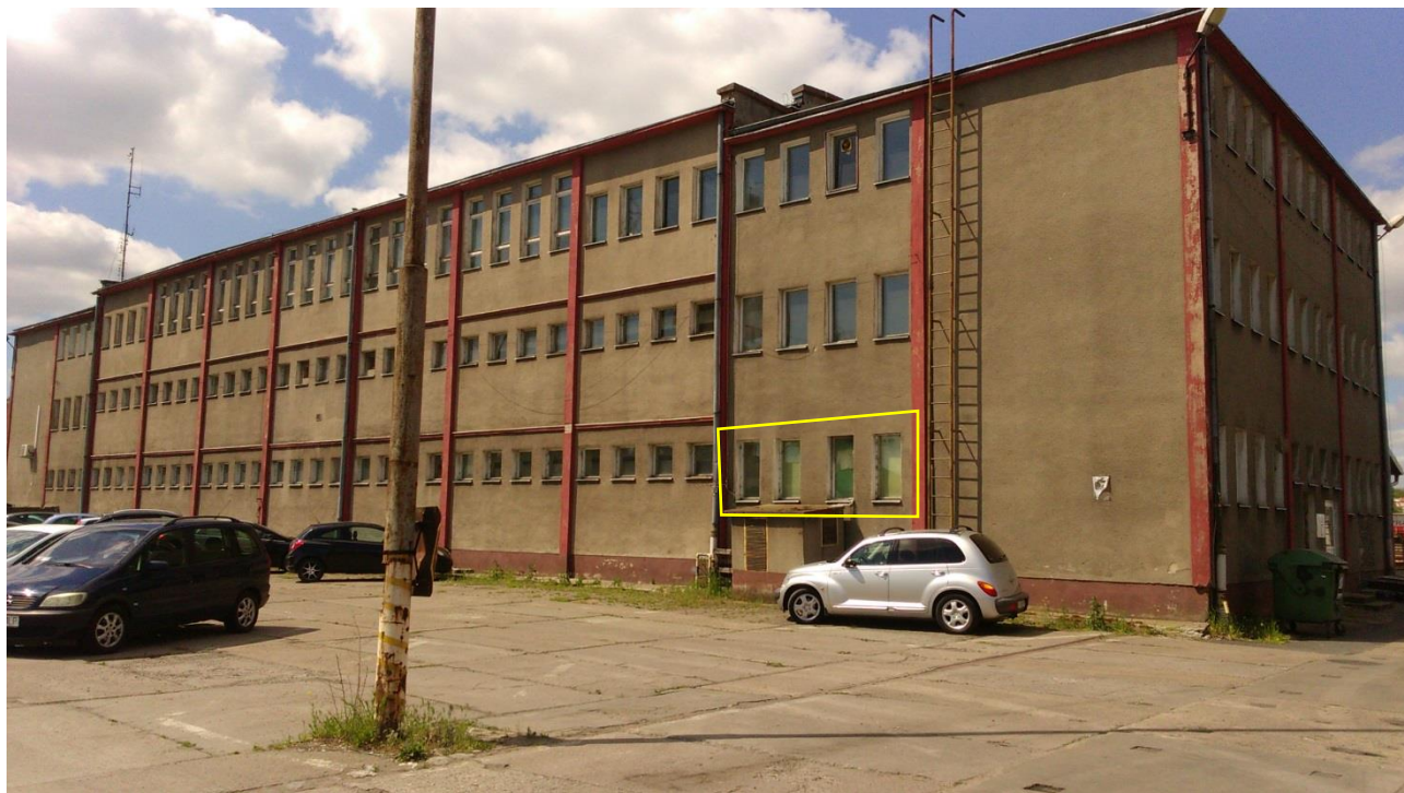
Zdj. 1. Widok elewacji wschodniej. Zaznaczone okna do wymiany.