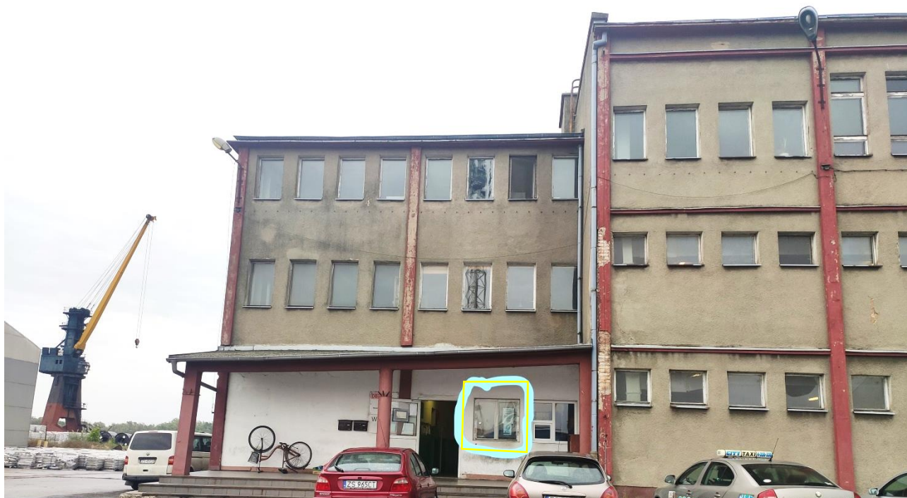
Zdj. 5. Fragment północno-zachodniego narożnika. Zaznaczone okno w portierni do wymiany.