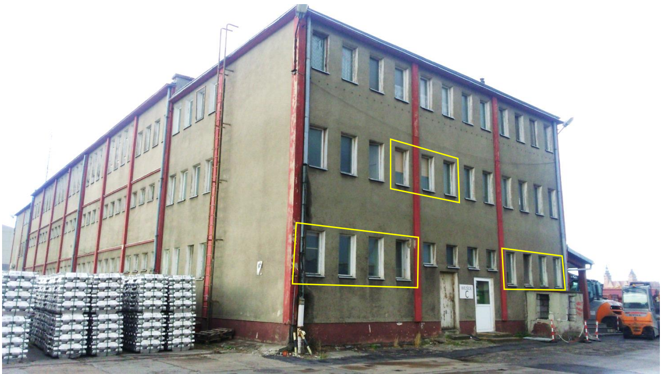
Zdj. 4. Widok ściany północnej. Zaznaczone okna do wymiany.