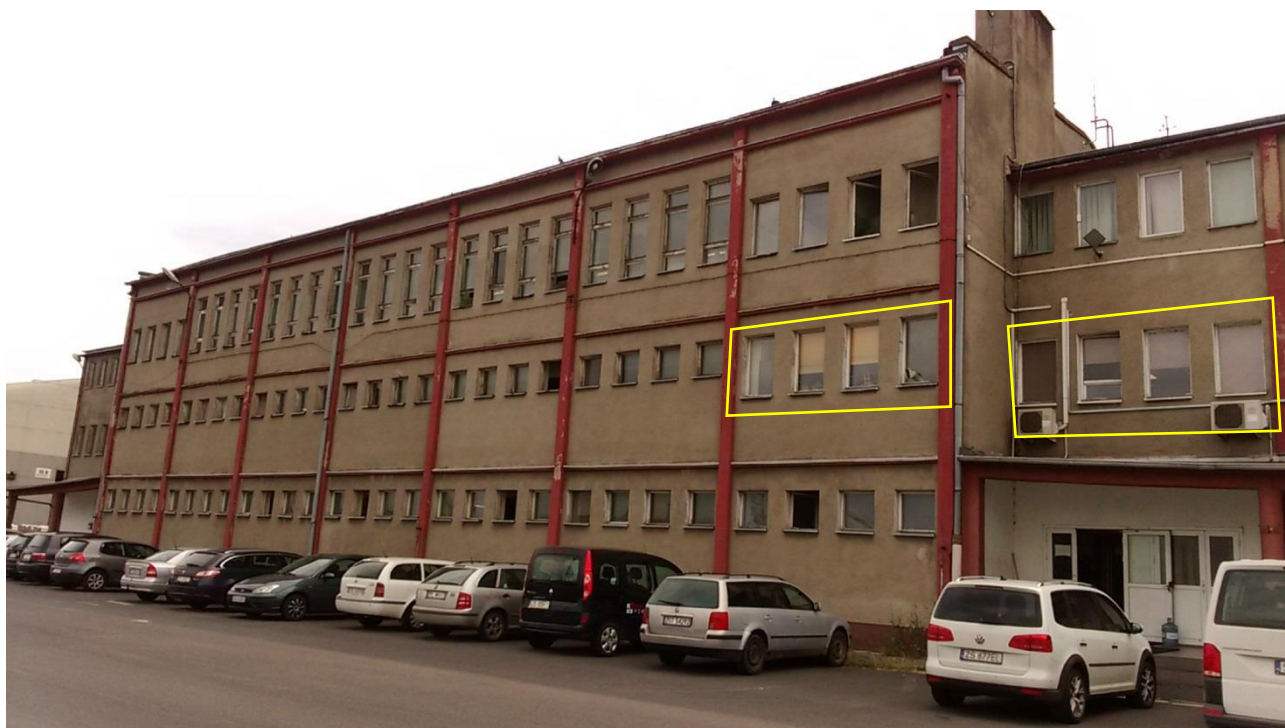
Zdj. 2. Widok elewacji zachodniej.