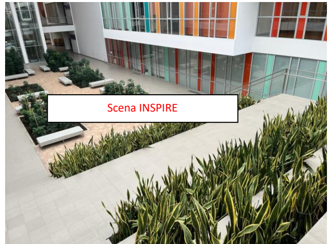
Lokalizacja INSPIRE Strefa B