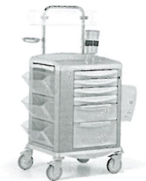
(Zdjęcie poglądowe oferowanego wózka)

Odp: Zamawiający dopuszcza obok istniejącego zapisu w OPZ.