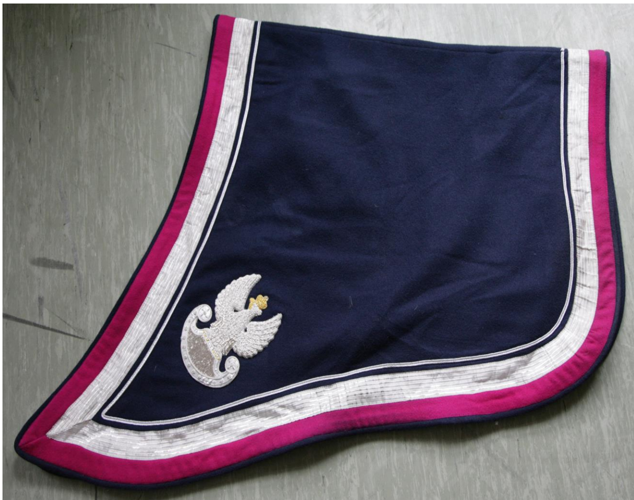
Wzór orła na czaprak dowódcy szwadronu