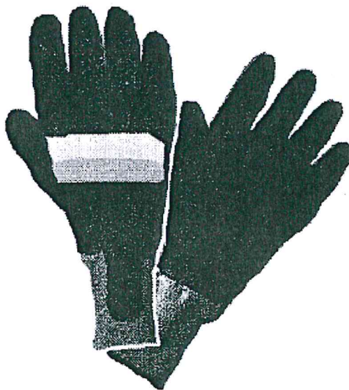
Przykładowy rysunek rękawic specjalnych