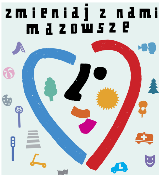
Rysunek 15 Plakat promujący BOM