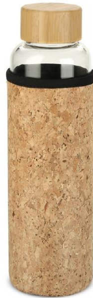
Rysunek 10 Zdjęcie poglądowe butelka