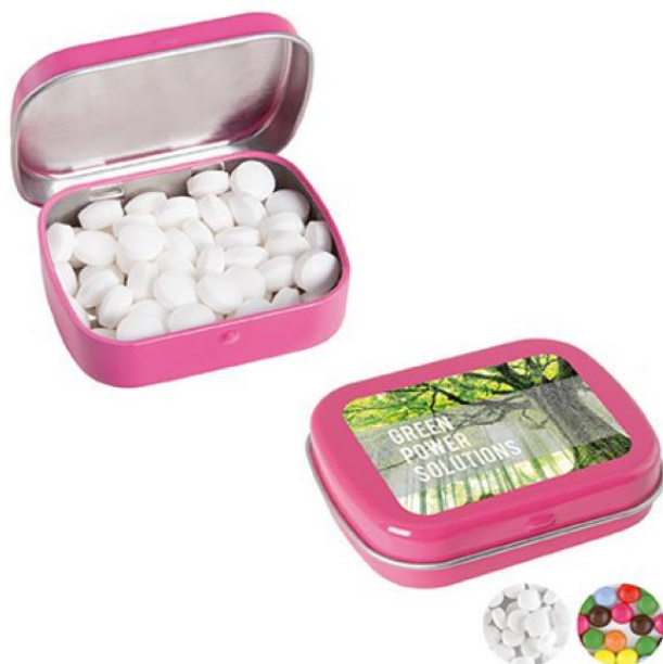
Rysunek 6 Zdjęcie poglądowe opakowania do cukierków