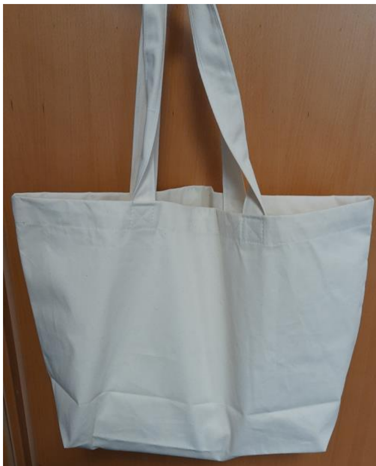
Rysunek 3 Zdjęcie poglądowe torba plażowa

materiał: bawełna min. 250gr/m 2 , rozmiar: 60x40 cm, dno 23 cm, kolor: naturalny, ecru, rączki: taśma, bawełna 100%, szerokość 40 mm, długość 63 cm, kieszonka wewnętrzna: bez zamka wykonana z 250g/m 2 - kolor naturalny, ecru - wymiar 25x15 cm - wszyta pod zakładkę na rączki po przeciwnej stronie niż nadruk, nadruk: jednostronny, wykonany technika sitodruku, wielkość nadruku A4.