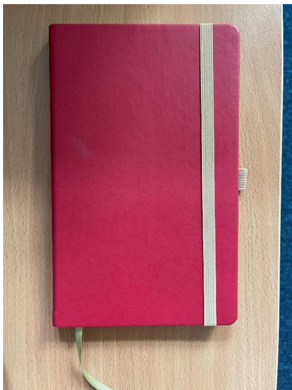
Rysunek 4 Zdjęcie poglądowe notesu

rozmiar: 130 x 210 mm w kratkę lub linie, papier: 80 g/m 2 , jabłkowy, certyfikowany FSC, wykończenie: oprawa szyta, zakładka w kolorze beżowym, zaokrąglone narożniki bloku i oprawy, kolor: granatowy, malinowy (możliwa modyfikacja kolorów), ilość stron: około 190, nadruk: tłoczone logo z dwóch stron (z przodu logo BOM, z tyłu logo Mazowsze).