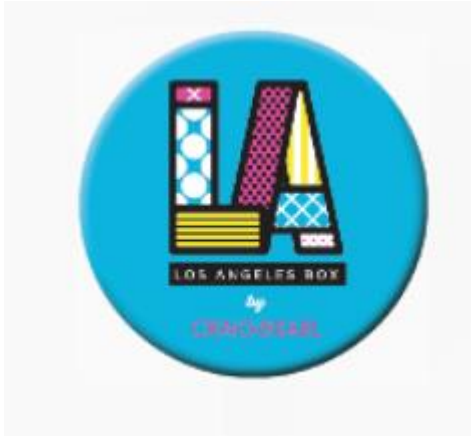
Rysunek 11 Zdjęcie poglądowe przypinka