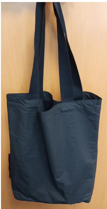
Rysunek 2 Zdjęcie poglądowe torba

materiał: tyvek soft, preferowany matowy powlekany (opcjonalnie błysk), rozmiar: 55x44x10 cm, kolor: czarny, podszewka: bawełna 100% typu drelich 280 gm2, rączki: taśma nośna tkana, bawełniana 100%, szer. 40 mm, metka: czarna PP z nadrukiem, druk sublimacyjny awers full kolor, tył apla, nadruk: jednostronny, wykonany techniką sitodruku.