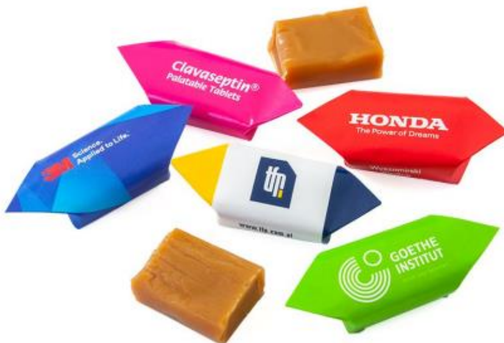
Rysunek 1 Zdjęcie poglądowe cukierków

Cukierek „krówka”, ręcznie zawijane ciągutki, smak mleczny, tradycyjne, staropolskie receptury, waga netto ok. 12-14 g, wymiary etykiety ok. 68-73 mm, okres przydatności przynajmniej 4 miesiące, pakowane w karton zbiorczy po ok. 5 kg. Logotyp umieszczony na etykiecie – druk cyfrowy CMYK.