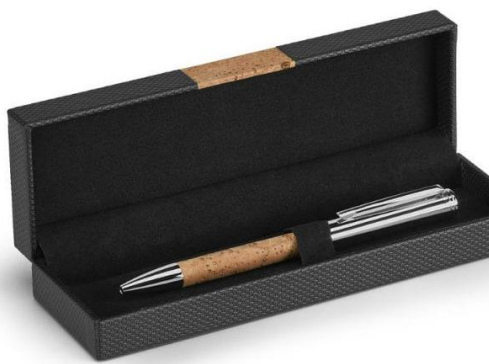
Rysunek 8 Zdjęcie poglądowe długopis w pudełku