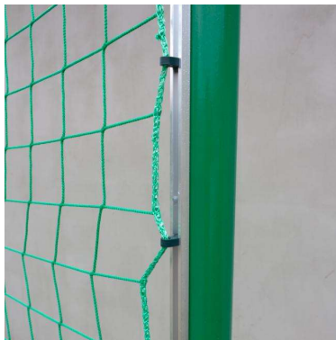
Przykładowy profil do mocowania haczyków siatki piłkochwyty

ogniowo, zakotwionych w fundamentach betonowych umożliwiające ich montaż i demontaż. Wymaga się słupów piłkochwyty aluminiowych lakierowanych proszkowo. Słupy piłkochwyty dodatkowo wzmocnione ożebrowaniem. Wymaga się, aby słupy piłkochwyty posiadały specjalne przetłoczenia do mocowania siatki za pomocą haczyków lub zostały wyposażone w dodatkowy profil aluminiowy do ich mocowania ułatwiający demontaż i ponowny montaż siatki.