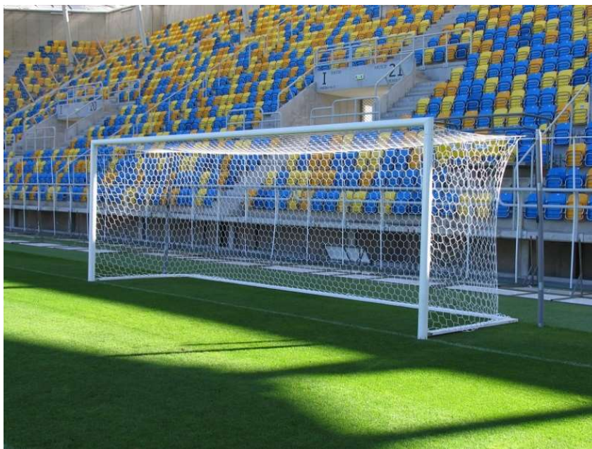
Przykładowa bramka do piłki nożnej

Należy przewidzieć wyposażenie boiska ze sztucznej trawy w dwie profesjonalne bramki o wymiarach 7,32 x 2,44m i głębokości 200cm. Bramki wykonane z aluminium, demontowalne, osadzone w tulejach w fundamentach betonowych. Słupki bramek owalne o wymiarach 120 x 100mm. Bramka z odciągami. Siatki do bramek. Bramka zgodna z przepisami PZPN i FIFA.