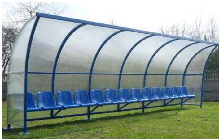
Przykładowa wiaty dla zawodników rezerwowych

Boisko ze sztucznej trawy zostanie wyposażone w dwie wiaty dla zawodników rezerwowych – każda z nich z 13 miejscami siedzącymi. Wiaty o długości min. 6,6m z siedziskami plastikowymi, o konstrukcji z profili aluminiowych, z pokryciem z poliwęglanu komorowego. Siedziska z oparciem o wysokości min. 325mm. Wiaty zaprojektowano jako mobilne. Wiaty rozstawione symetrycznie w stosunku do linii środkowej. Należy również dostarczyć trzyosobową wiatę dla personelu medycznego o konstrukcji identycznej jak dla wiat dla zawodników rezerwowych.