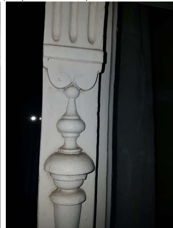
Fot. 15 i 16 - Istn. okno dwuskrzydłowe – widok na listwy przymykowe dekoracyjne od zewnątrz – sala ślubów, stan zachowania: w górnej i środkowej części stan dobry, w dolnej średni/zły