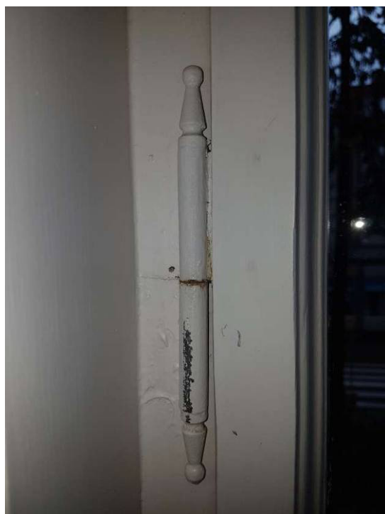
Fot. 21 i 22 - Istn. okno dwuskrzydłowe – widok istniejących okuć oryginalnych, stan zachowania - dobry