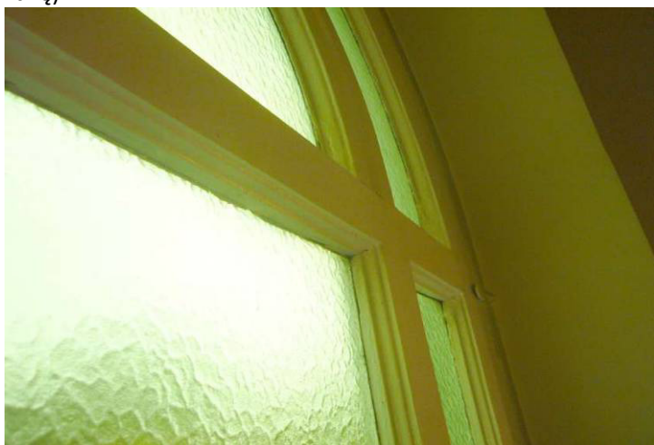
Fot. 29 - Istn. okno krosnowe w klatce schodowej – widok od strony wewnętrznej, widoczna różnica w szerokości ramiaków okna i ich profilowania w części górnej półkolistej i dolnej prostokątnej