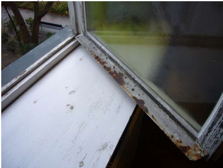
Fot. 31 - Istn. okno krosnowe w klatce schodowej – widok na część dolną skrzydła okiennego – okapnik stalowy, stan zachowania zły, złuszczenia farby, blacha przeżarta rdzą, dolna części ościeżnicy drewnianej - zniszczona, stan średni/zły