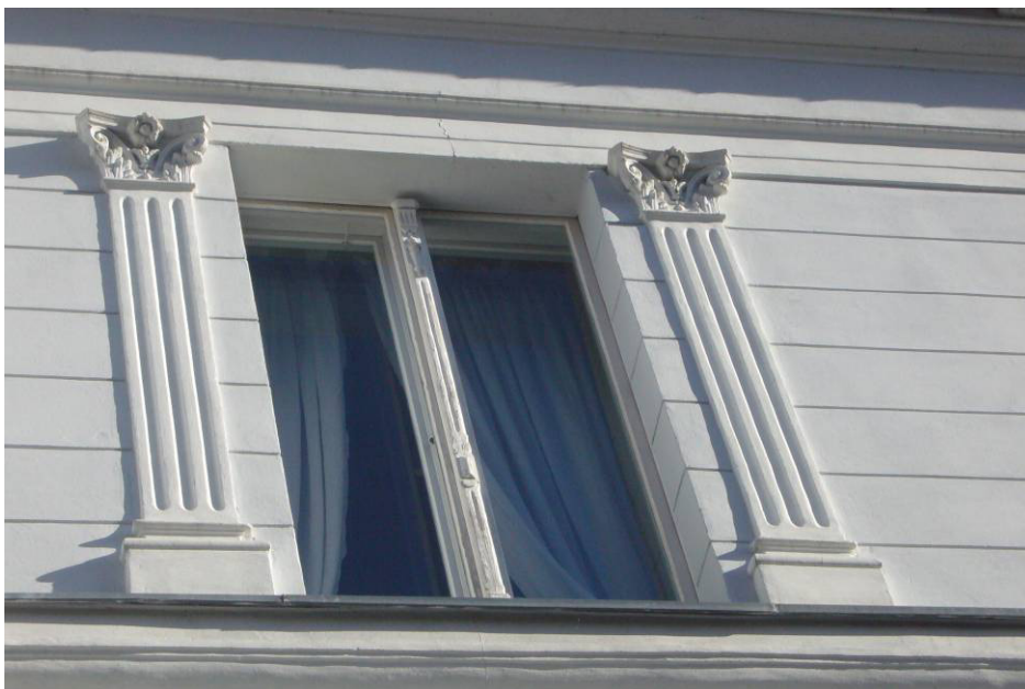
Fot. 8 - Istn. okno dwuskrzydłowe – widok od zewnątrz – elewacja ptn, stan zachowania średni, na fragmentach - zły: złuszczenia farby, spękania drewna, zawilgocenia dolnych partii okna