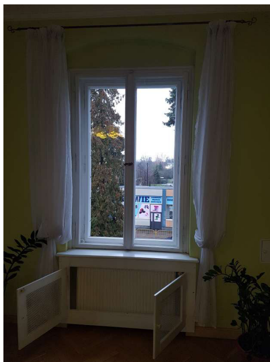
Fot. 9 i 10 - Istn. okno dwuskrzydłowe – widok od wewnątrz – sala ślubów, stan zachowania średni/zły: złuszczenia farby, spękania drewna, szczególnie w dolnej części okna, wtórne obudowy grzejników bez kratki nawiewnych w parapetach okiennych