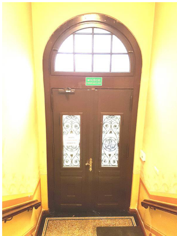
Fot. 1 i 2. Istn. drzwi wejściowe, elewacja zach, widok od zewnątrz i wewnątrz, stan zachowania - średni