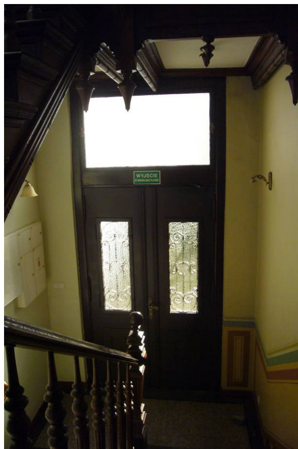
Fot. 3 i 4. Istn. drzwi wejściowe, elewacja półd, widok od zewnątrz i wewnątrz, stan zachowania - średni