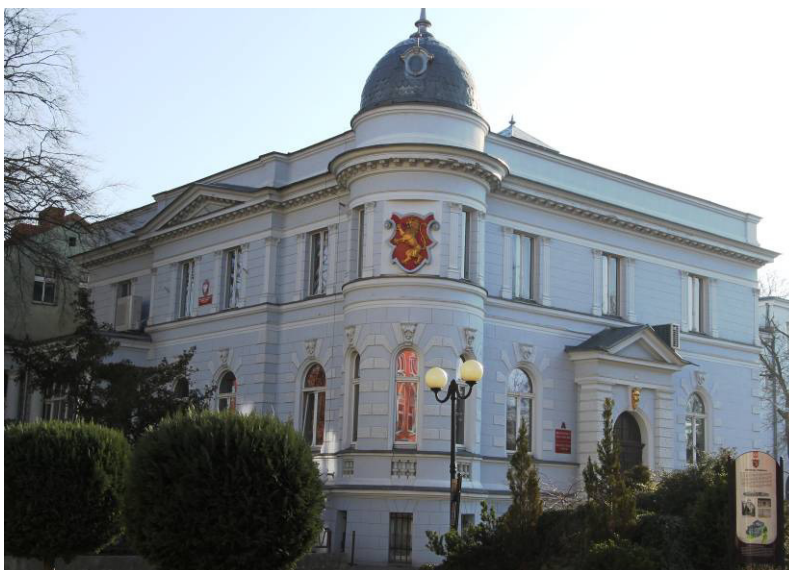
Elewacja półn – zach.