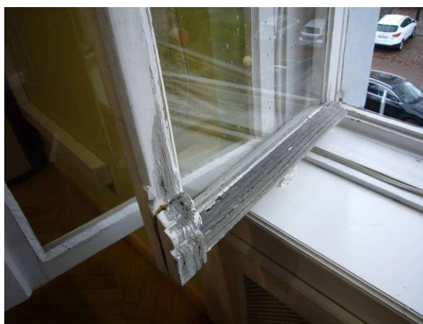
Fot. 19 i 20 - Istn. okno dwuskrzydłowe – widok na listwy przymykowe dekoracyjne od zewnątrz – sala ślubów, stan zachowania: w górnej i środkowej części stan zachowania dobry, w dolnej części złuszczenia farby, spękania drewna, zniszczenia (poprzez zawilgocenia drewna) okapników drewnianych, ślady zagłonicenia