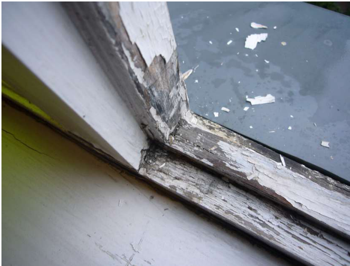
Fot. 30 - Istn. okno krosnowe w klatce schodowej – widok na część dolną ościeżnicy okna, stan zachowania zły, złuszczenia farby, spękania drewna, zawilgocenie, złe połączenie z obróbką blacharską parapetu