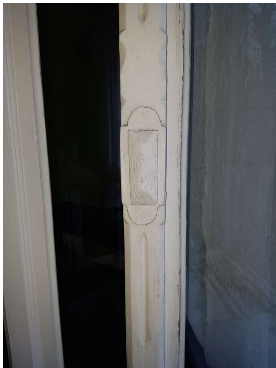
Fot. 17 i 18 - Istn. okno dwuskrzydłowe – widok na listwy przymykowe dekoracyjne od zewnątrz – sala ślubów, stan zachowania: w górnej i środkowej części stan dobry, w dolnej średni/zły