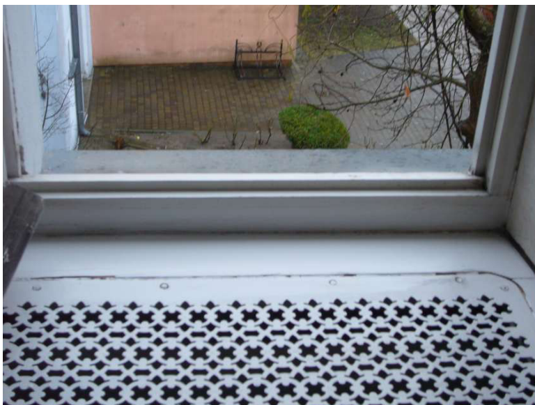
Fot. 26 - Istn. okno dwuskrzydłowe krosnowe – widok od strony wewnętrznej (pom. gospodarcze), widok oryginalnego nawiewnika ażurowego z blachy stalowej w poziomej płaszczyźnie parapetu oryginalnego drewnianego – stan średni