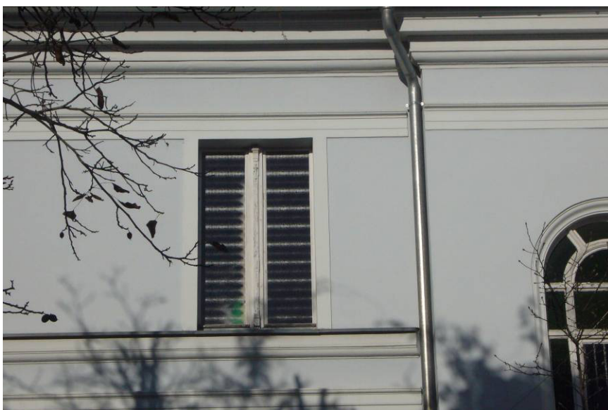
Fot. 23 - Istn. okno dwuskrzydłowe krosnowe (pom. gospodarcze i WC), elewacja pld – stan zachowania - średni, zniszczenia w dolnej części okna, złuszczenia farby, spękania drewna