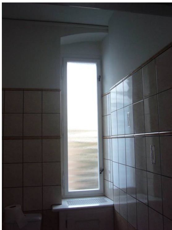
Fot. 24 i 25 - Istn. okno dwuskrzydłowe krosnowe – widok od strony wewnętrznej (pom. gospodarcze WC), stan zachowania średni, w dolnej części złuszczenia farby, spękania drewna, zniszczenia (poprzez zawilgocenia drewna) okapników drewnianych