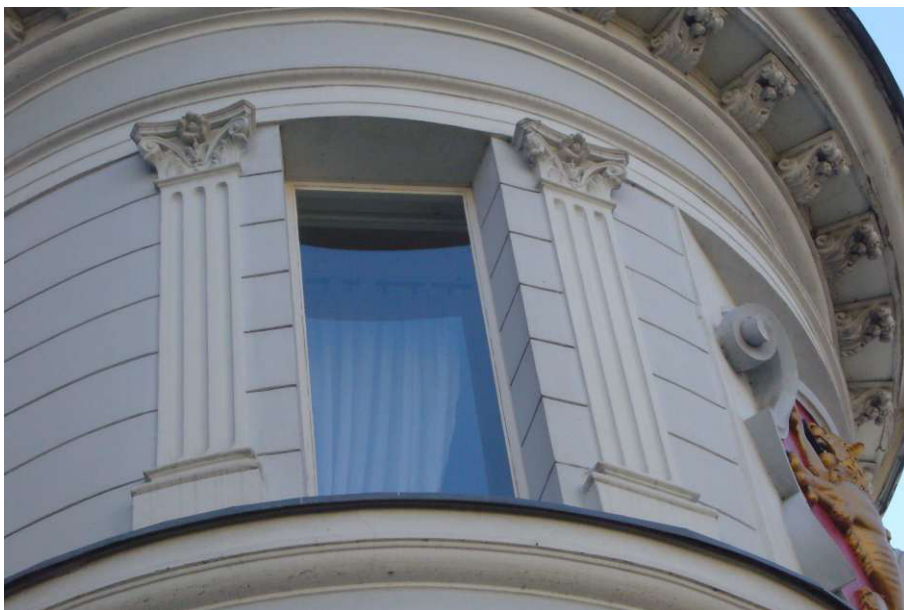
Fot. 5. Istn. okno jednoskrzydłowe, narożnik płn – zach., widok od zewnątrz, stan zachowania – średni