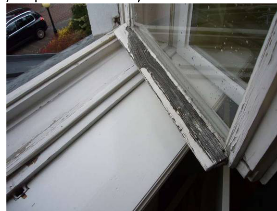
Fot. 13 i 14 - Istn. okno dwuskrzydłowe – widok od wewnątrz – sala ślubów, stan zachowania średni/zły: złuszczenia farby, spękania drewna, szczególnie w dolnej części okna, zniszczenia (poprzez zawilgocenia drewna) okapników drewnianych