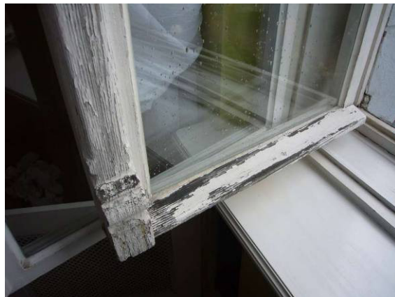
Fot. 11 i 12 - Istn. okno dwuskrzydłowe – widok od wewnątrz – sala ślubów, stan zachowania średni/zły: złuszczenia farby, spękania drewna, szczególnie w dolnej części okna, zniszczenia (poprzez zawilgocenia drewna) okapników drewnianych