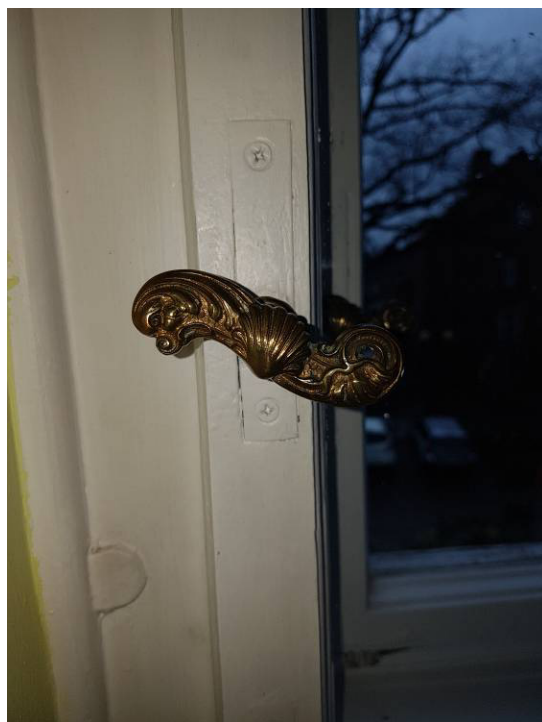
Fot. 6 i 7 - Istn. okno jednoskrzydłowe – okucia oryginalne: zawias okienny i klamka okienna (pom. sali ślubów), stan zachowania - dobry