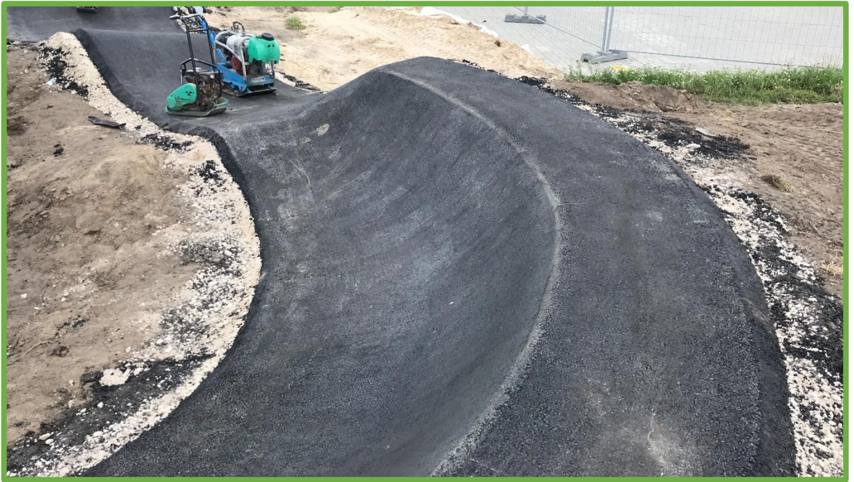
Prawidłowo wykonana nawierzchnia asfaltowa – jednorodna i gładka.

Wszystkie przeszkody wchodzące w skład rowerowego placu zabaw - PUMPTRACK (garby, muldy, przeszkody złożone itp.) muszą być wyprofilowane w taki sposób, aby umożliwiły płynną jazdę. Niedopuszczalne jest wyprofilowanie przeszkód wymuszających "nerwową jazdę" tzn. zbyt ostrych, o szpiczastych kształtach.