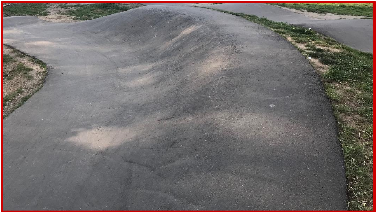
Nieprawidłowa powierzchnia nawierzchnia asfaltowa – nadmiernie chropowata z widocznymi rysami i nierównościami

Wygląd zewnętrzny warstwy jezdnej, sprawdzony wizualnie, powinien być jednorodny, bez spękań, deformacji, plam i wyruszeń.