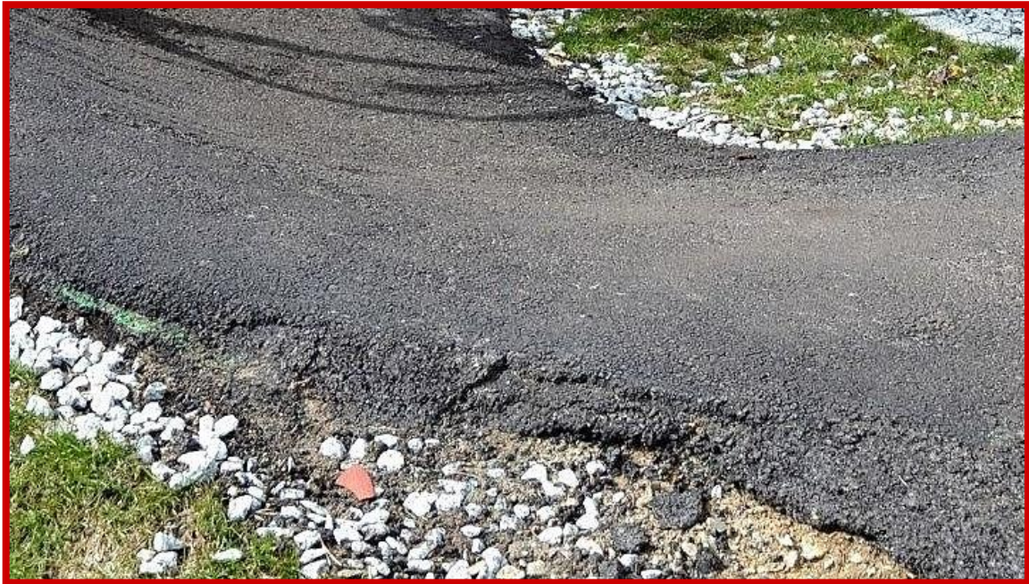
Nieprawidłowe wykończenie krawędzi nawierzchni jezdnej – nierówne, bez fazowania, z ubytkami i pęknięciami.