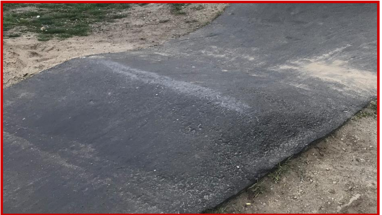
Niepoprawnie wykonany garb – o licznych nierównościach i złym kształcie

Wszystkie przeszkody wchodzące w skład rowerowego placu zabaw - PUMPTRACK (garby, muldy, przeszkody złożone itp.) muszą być wyprofilowane w taki sposób, aby umożliwiły płynną jazdę. Niedopuszczalne jest wyprofilowanie przeszkód wymuszających "nerwową jazdę" tzn. zbyt ostrych, o szpiczastych kształtach.