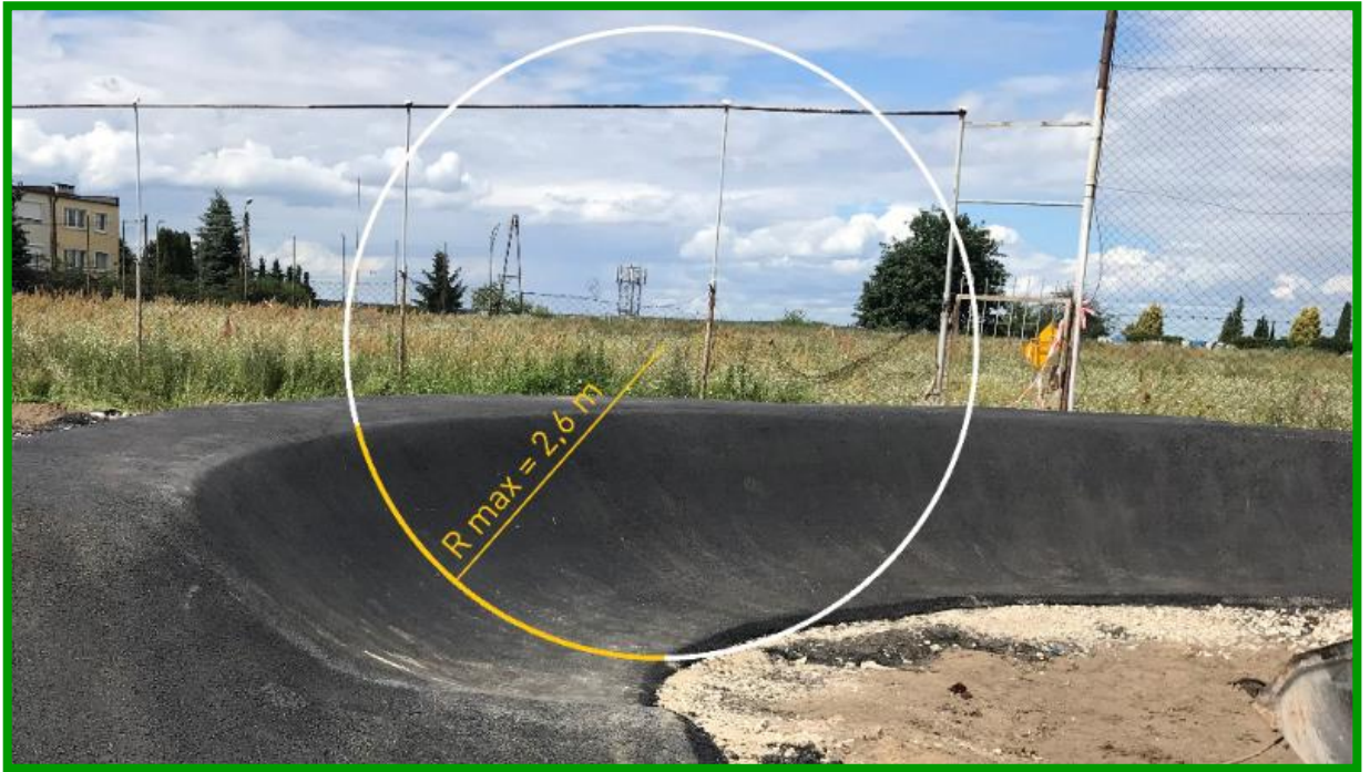
Prawidłowo wykonany zakręt profilowany, którego przekrój stanowi wycinek koła.