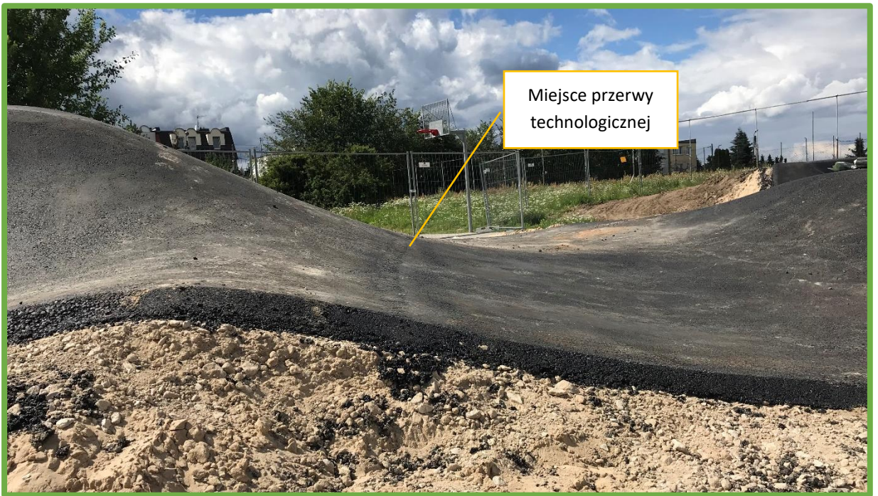
Prawidłowo wykonane połączenia – bez wyczuwalnych uskoków ani zmian profilu przeszkody.