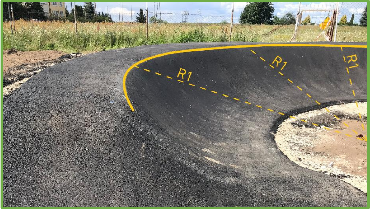
Prawidłowo wykonany zakręt profilowany – o jednostajnym promieniu zakrętu