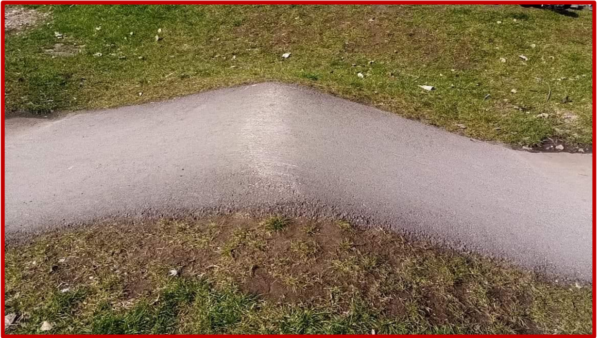
Niepoprawnie wyprofilowany garb – podjazd i zjazd płaski, szpiczasty kształt przeszkody