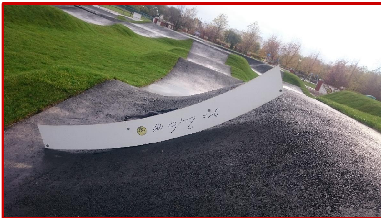
Nieprawidłowo wykonany zakręt profilowany, którego przekrój nie stanowi wycinka koła.

Warstwa jezdna wszystkich zakrętów musi być w przekroju wycinkiem koła o promieniu nie większym niż 2,6 metra. Niedopuszczalne jest stosowanie zakrętów profilowanych (tzw. band), które są w przekroju płaskie lub ich promień jest niejednostajny. Wyjątek stanowi dolna półka bandy, która może być wypłaszczona.