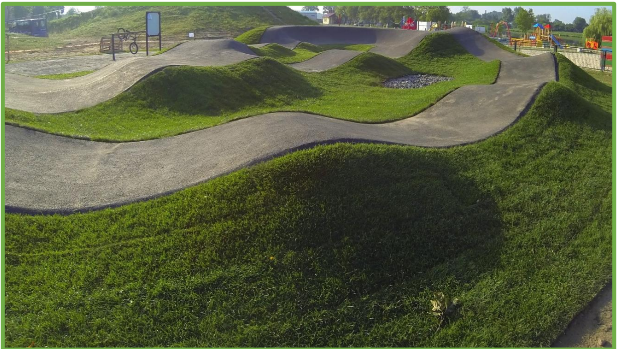
Garby o prawidłowo wyprofilowanych kształtach

Wszystkie krawędzie warstwy jezdnej muszą być sfazowane pod kątem 45^{\circ} ( \pm 5^{\circ} ). Fazowanie i zagęszczanie krawędzi musi odbywać się podczas układania warstwy. Niedopuszczalne jest fazowanie (cięcie) po wystygnięciu masy mineralno-asfaltowej. Krawędzie muszą być wykonane w równej linii, bez pęknięć i ubytków.