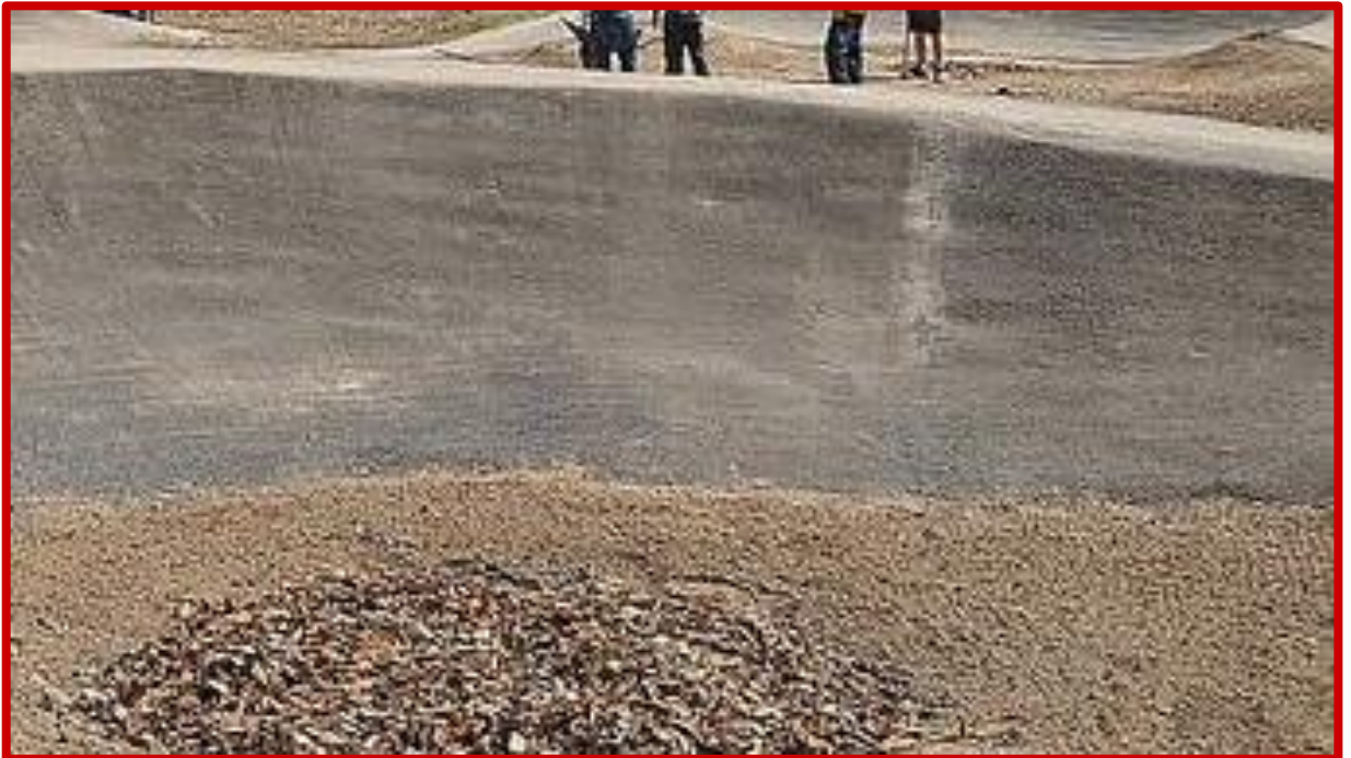
Nieprawidłowe połączenie nawierzchni jezdnej w miejscu przerwy technologicznej

Połączenia nawierzchni jezdnej w miejscach przerw technologicznych muszą być tak wykonane, aby nie były wyczuwalne uskoki ani zmiany profilu przeszkody.