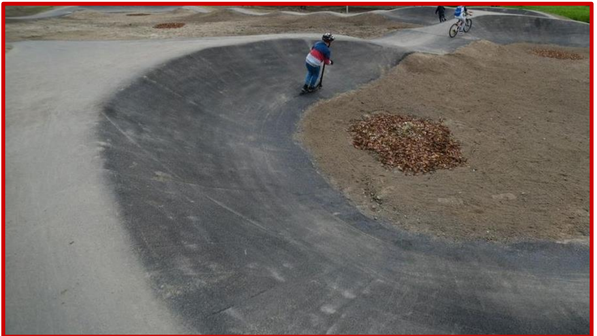
Nieprawidłowo wykonany zakręt o niejednostajnym promieniu, bez wypłaszczonej dolnej półki oraz niebędący w przekroju wycinkiem koła.