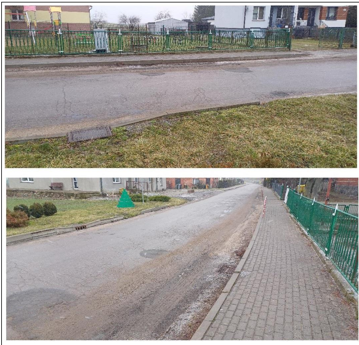
DW 641 Rzeżęcín