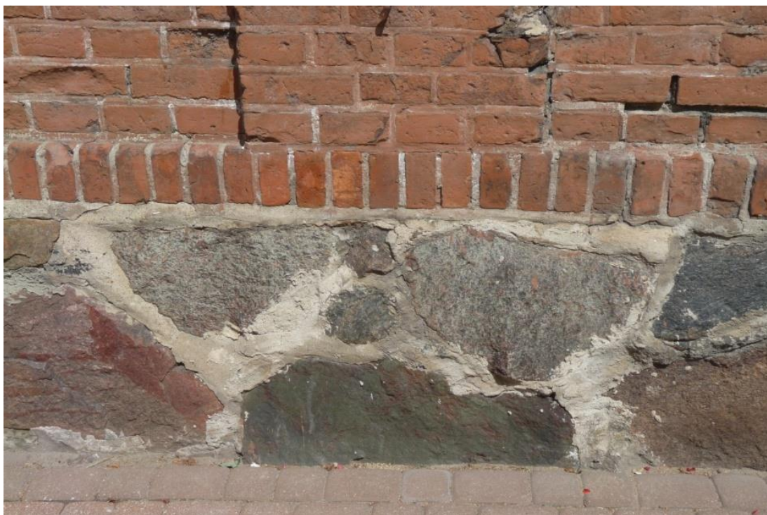
19. NAROŻNIK KOŃCOWY MURU OD STRONY ZACHODNIEJ