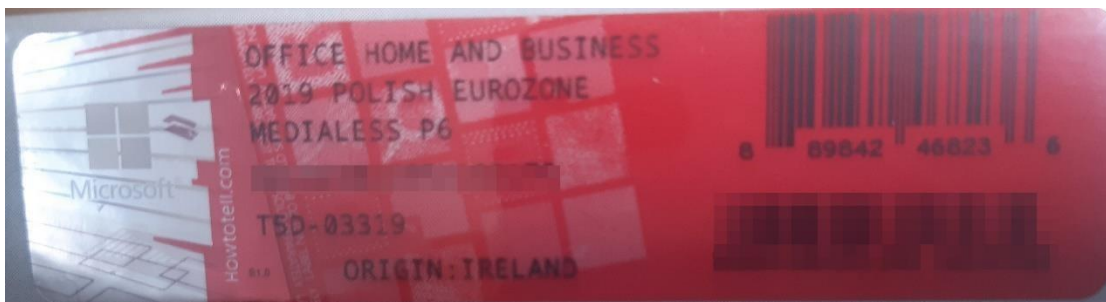
Rys. 2 przykładowy kod zabezpieczony przez producenta systemu Microsoft Windows Office Home&Business z wymazanym, znajdującym się w prawym dolnym rogu numerem seryjnym produktu. Kod licencyjny znajduje się w środku szczelnie zapakowanego i zafoliowanego pudełka (Rys. 3)