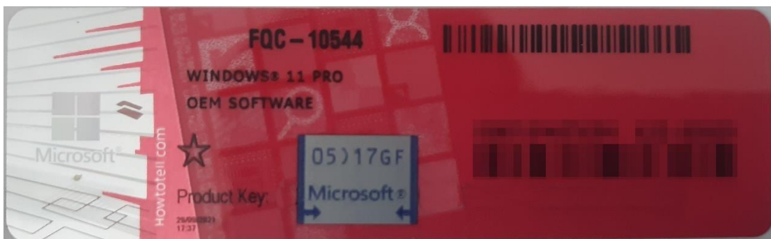
Rys. 1 przykładowy kod zabezpieczony przez producenta systemu Microsoft Windows 11 (takie same naklejki mają Windows 10) z wymazanym, znajdującym się przed i za szarą naklejką kodem licencyjnym

Poniższe zdjęcie obrazuje obecnie stosowane zabezpieczenia producenta firmy Microsoft (klucz systemu jest zabezpieczony naklejką hologramową przez producenta. Po jej zdrapaniu uzyskujemy dostęp do oryginalnego klucza):