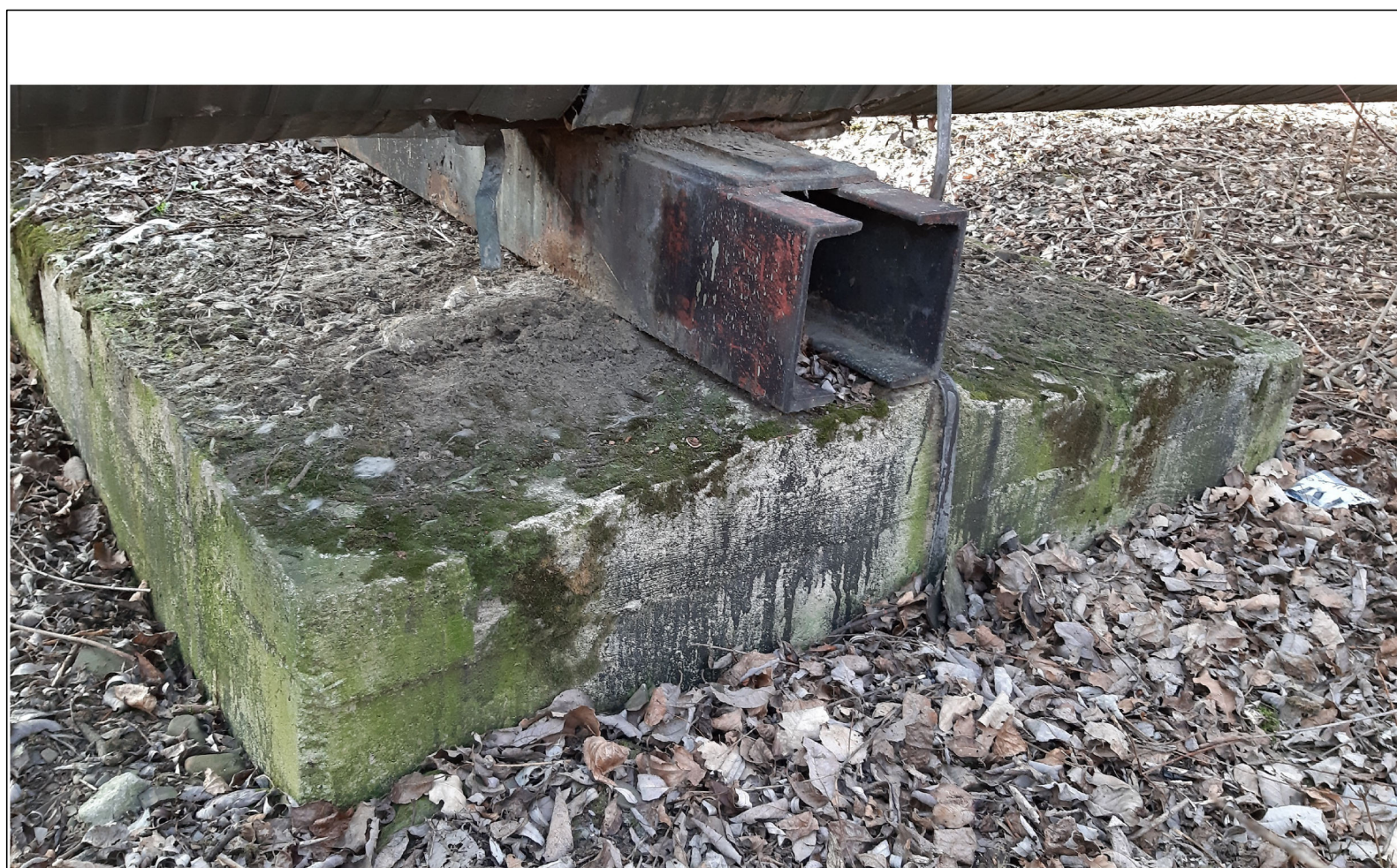
PODPORA ŚLIZGOWA P-74