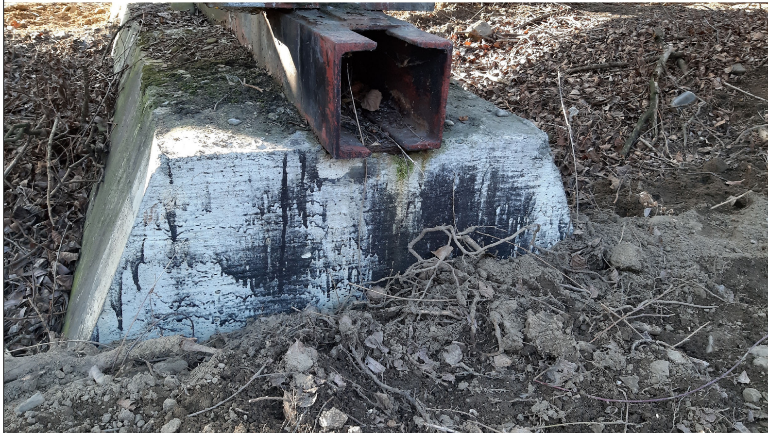
PODPORA ŚLIZGOWA P-68