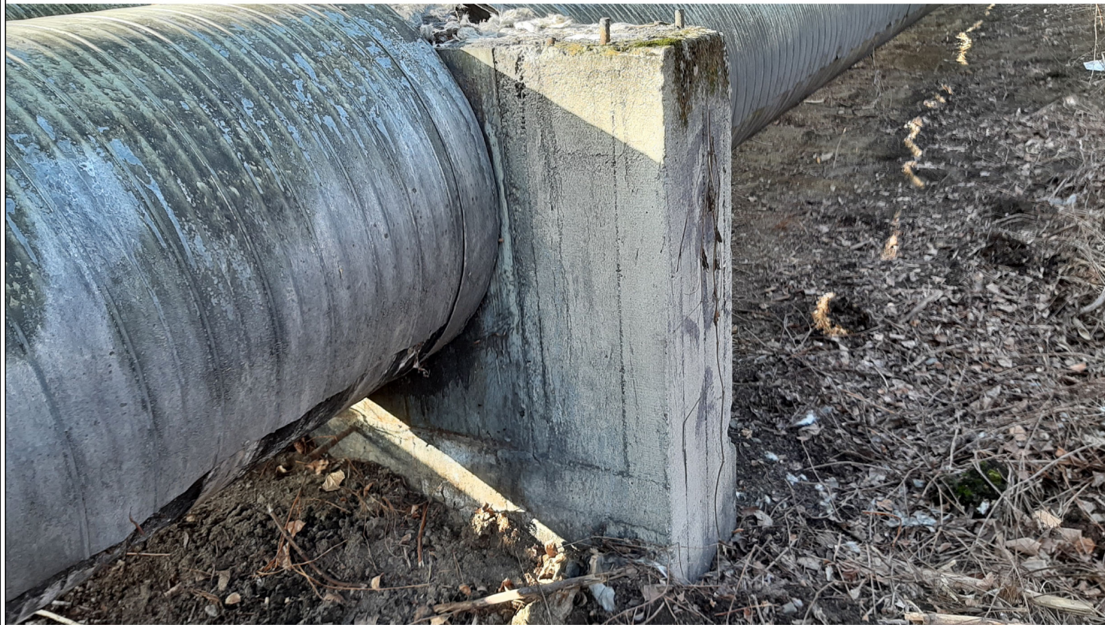
PUNKT STAŁY PS-14