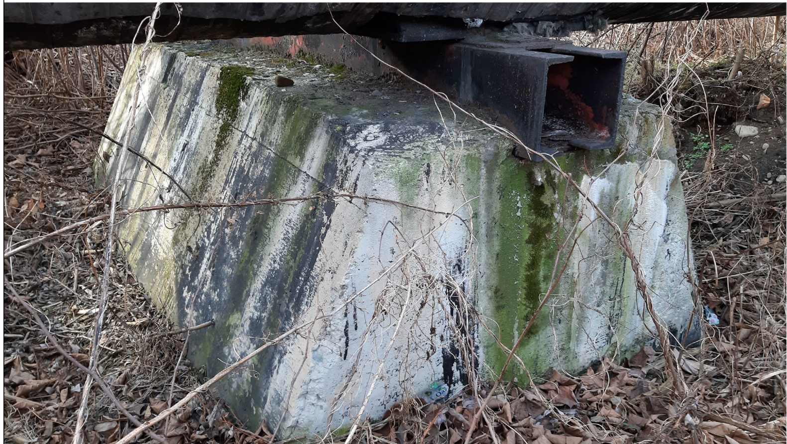
PODPORA ŚLIZGOWA P-82