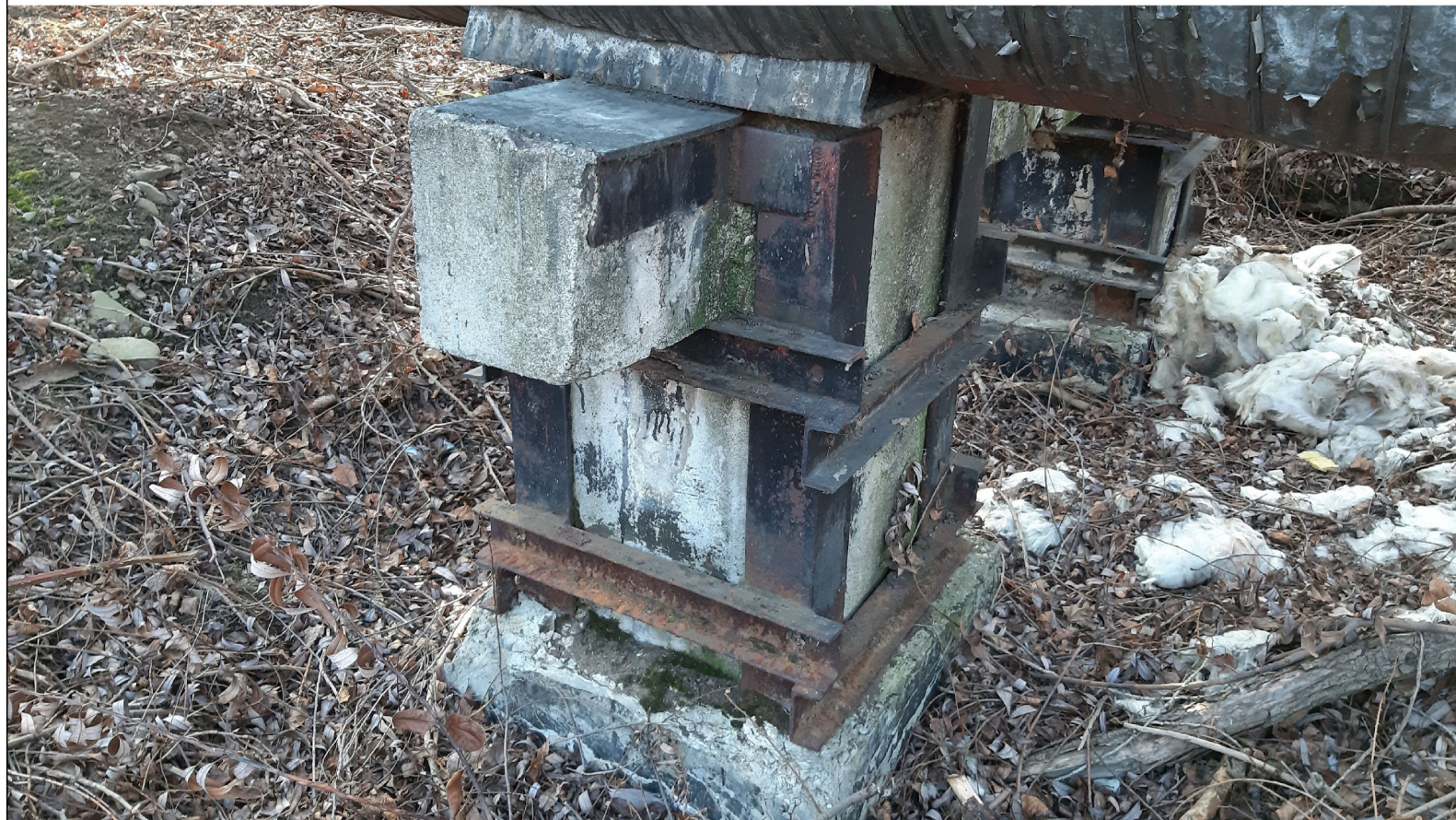
PODPORA ŚLIZGOWA P-79