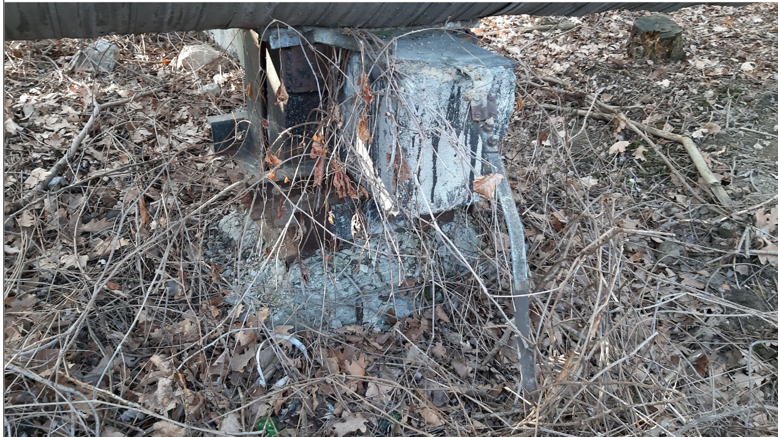
PODPORA ŚLIZGOWA P-67