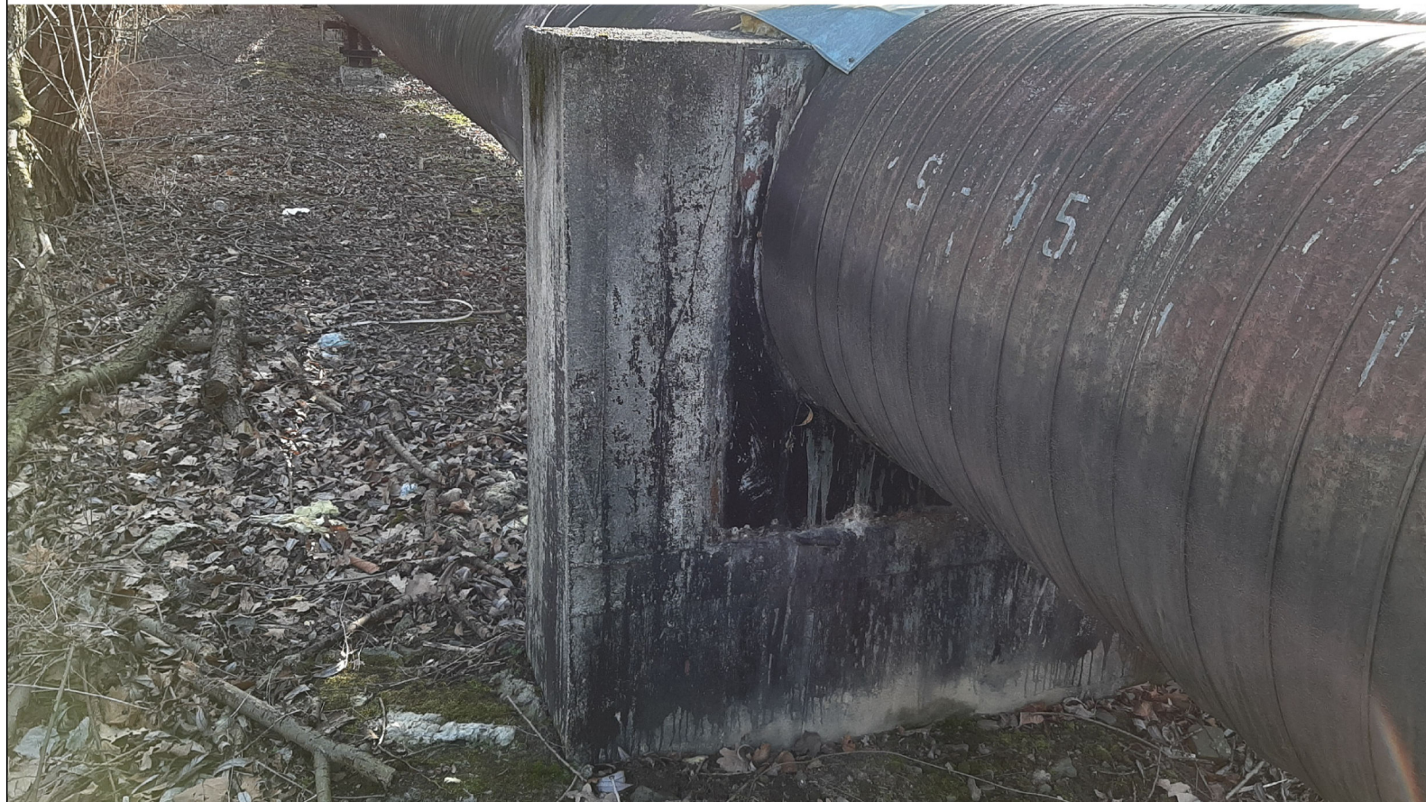
PUNKT STAŁY PS-15