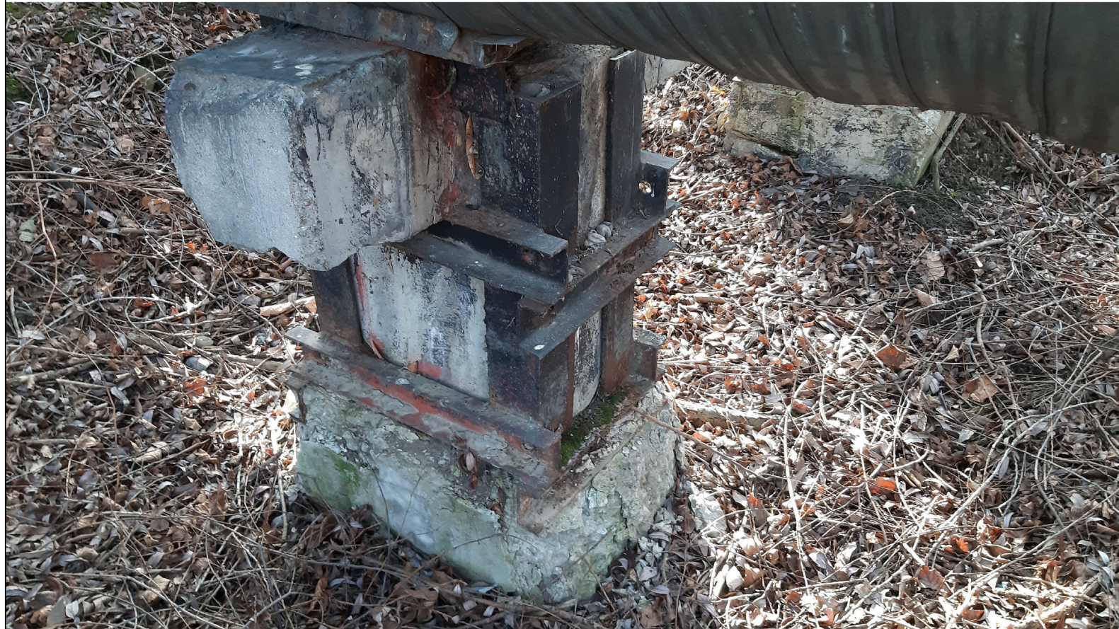
PODPORA ŚLIZGOWA P-78