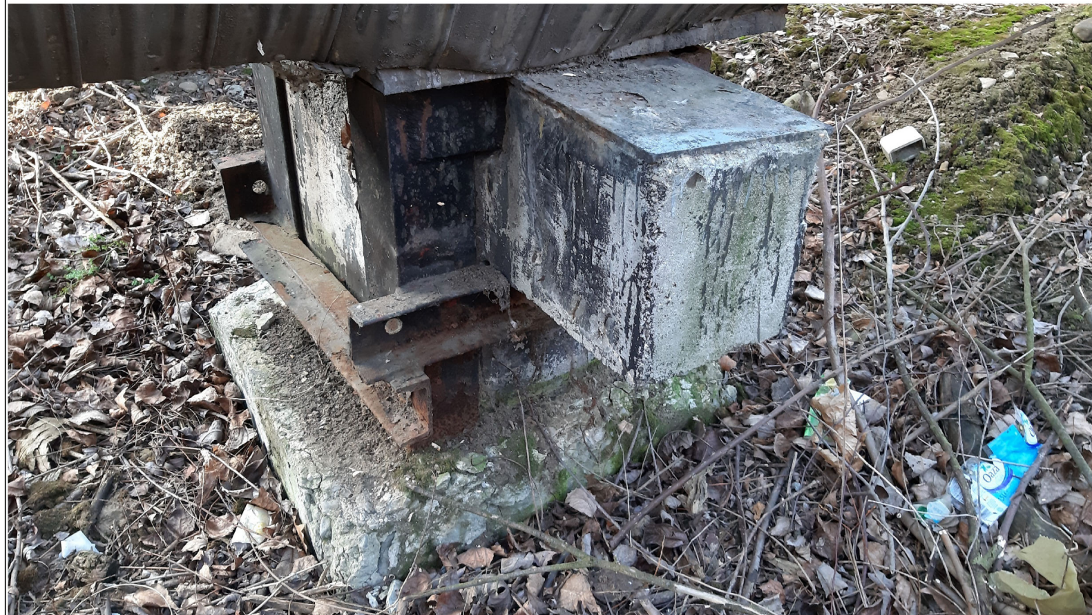
PODPORA ŚLIZGOWA P-71