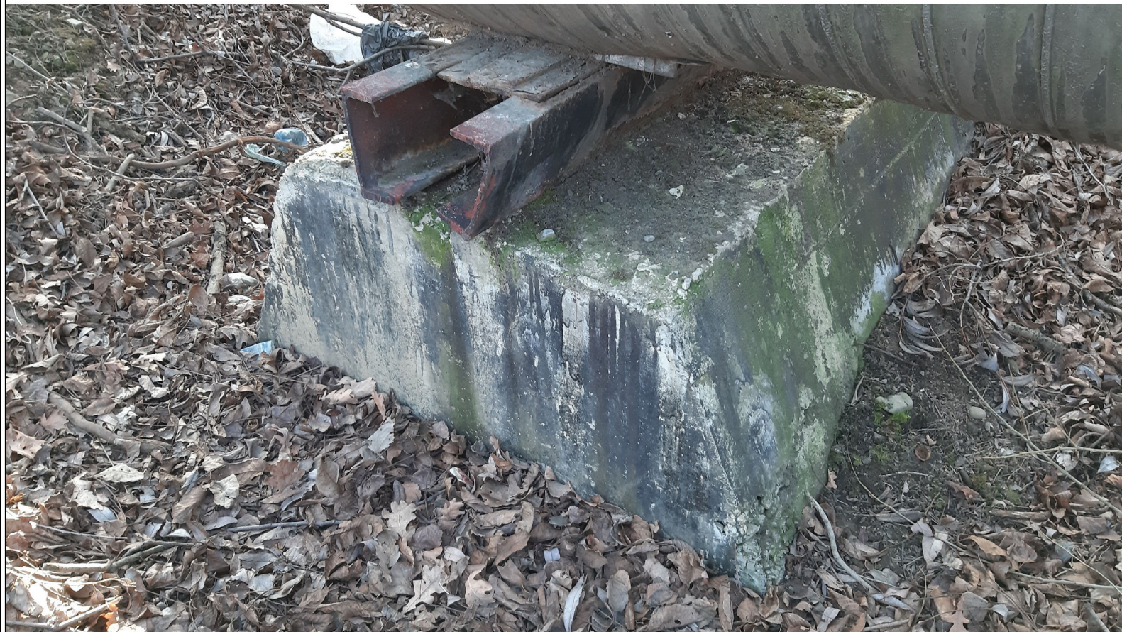
PODPORA ŚLIZGOWA P-69