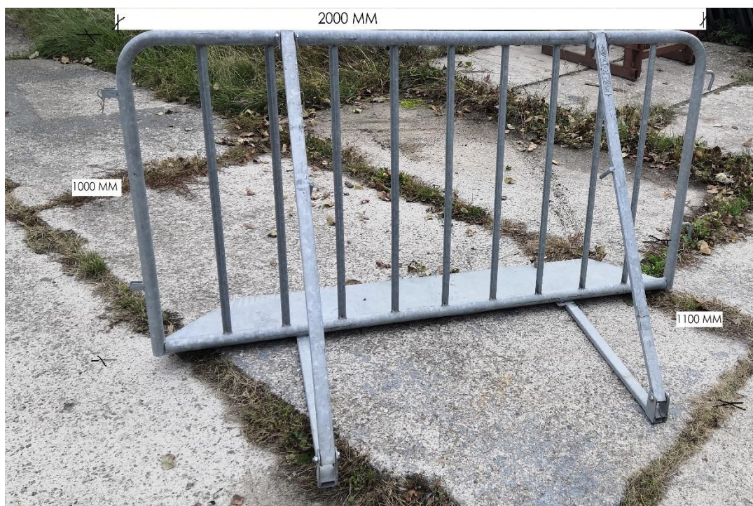
14. Cały element (płot) cynkowany ogniowo.