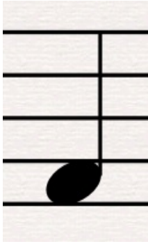
Ćwierćnuta składająca się z główki oraz laski.