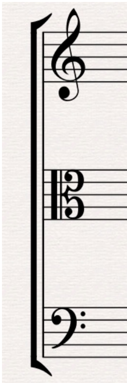
Klucze, od góry: wiolinowy, altowy, basowy.