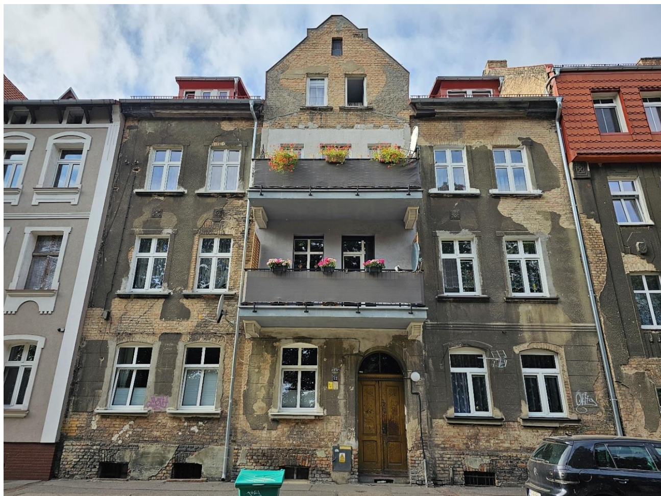
Remont elewacji frontowej oraz docieplenie i kolorystyka elewacji podwórzowej budynku mieszkalnego, wielorodzinnego ul. Wawrzyniaka 72, 66-400 Gorzowie Wlkp., kat. ob. XIII.

Obramienia okienne z prostych profili częściowo są zdegradowane wymagają odtworzenia.