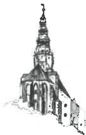
Kościół pw. Św. Stanisława i Św. Wacława Katedra Diecezji Świdnickiej

Działając na podstawie art. 222 ust. 4 ustawy z dnia 11 września 2019 r. - Prawo zamówień publicznych (Dz. U. z 2023 r. poz. 1605), Zamawiający informuje, że na sfinansowanie zamówienia zamierza przeznaczyć kwotę 630.000,00 zł .