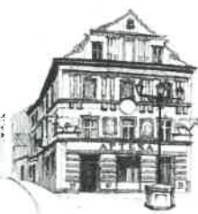
Kamienica „Pod Bykami”