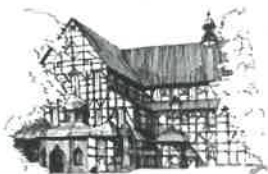
Kościół Pokoju pw. Św. Trójcy Wpisany na listę UNESCO