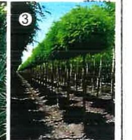
Robinia akacja Umbraculifera min. wys. sadzonki min. 250 cm