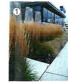
Trzcinnik ostrokwiatowy 'Karl Foerster' Calamagrostis acutiflora