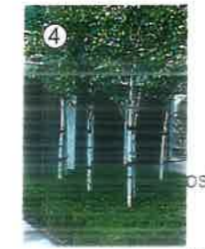
Brzoza pożyteczna DOORENBOS wys. sadzonki min. 250 cm