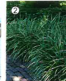
Turzyca Morrowa 'Ice Dance' Carex morrowii