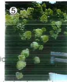
podest z drewna kompozytowego LIMELIGHT